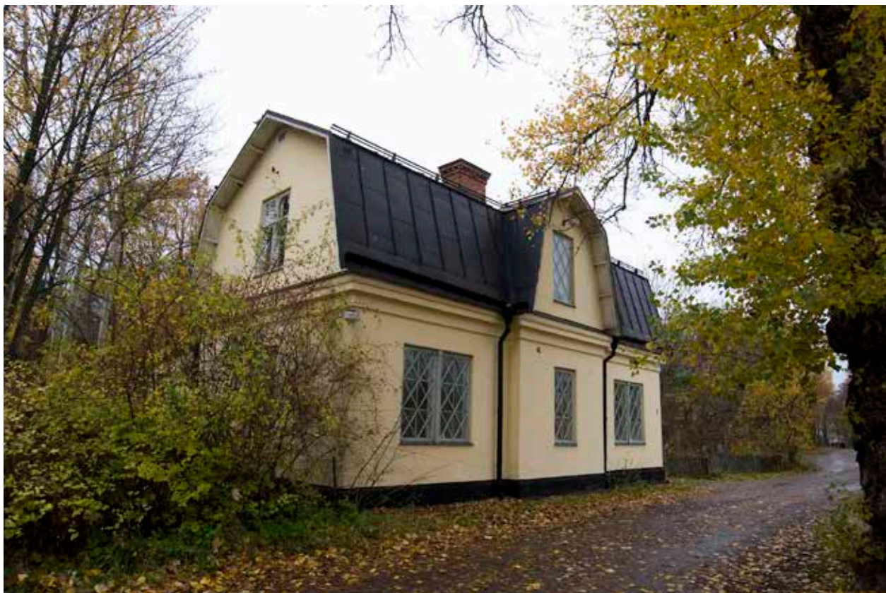
BOSTADSHUSET MED VY MOT NORDVÄST.