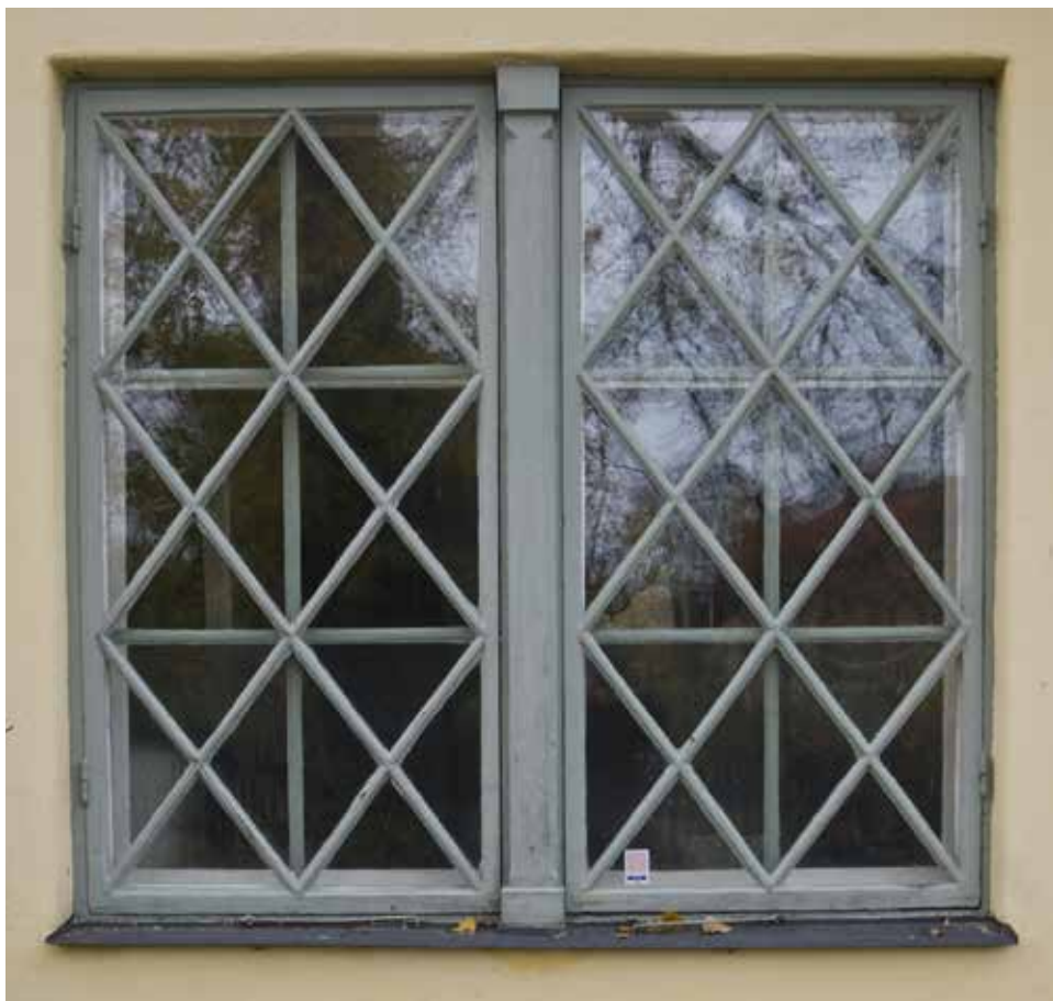
FÖNSTER MED DEKORATIVT UTFORMADE SPRÖJS OCH MITT- POST.

den såldes till grosshandlaren Lars Olsson Smith, även kallad brännvinskungen eftersom han hade ett brännvinsbränneri på Reimersholme. Omedelbart lät Smith utveckla gården med en pampig anläggning och med all tänkbar lyx. Smith skapade en imponerande trädgård med terrasser, grottor, promenadstigar och en kägelbana. Detta var gårdens glansperiod. Trädgården omtalades som en av Stockholms vackraste. Smith lät även uppföra nya byggnader, bland annat badhus med bassäng, en stor basilikaliknande biljardsalong och ett växthus med egen värmeanläggning. Under Smiths tid anlades en ny östlig körväg till huvudbyggnaden. Tidigare kunde Karlshäll nås via sjövägen och en körväg från Sofieberg i söder. Vid den nya infarten uppfördes en grind och en grindstuga, nuvarande Grindhålet 1. Smith var aldrig skriven på gården utan dels inne i staden, dels i Blekinge. I slutet av 1800-talet såldes fastigheten för att under 1900-talet få en helt ny användning. Mellan år 1904 fram till år 1977 fungerade det som ett vårdhem under olika huvudmän. Delar