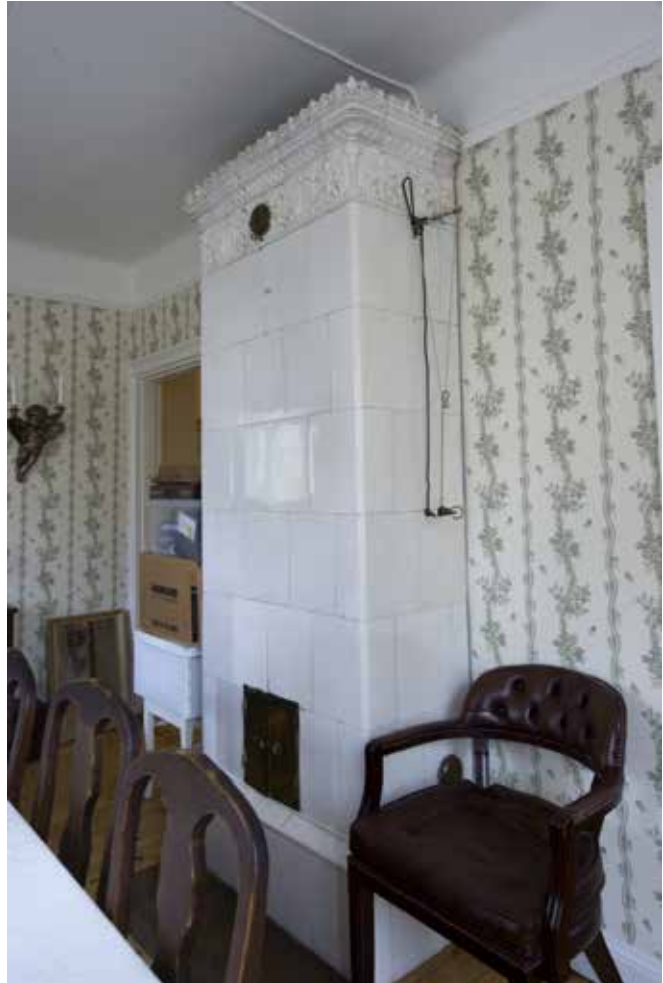
URSPRUNGLIG KAKELUGN.

Alla rum hade brädgolv, kalkrappade väggar och gipsade tak. I kökens tak fanns luckor upp till vinden som var avdelad i två delar. Yttertaket var enkelt med asfaltpapp på bräder.