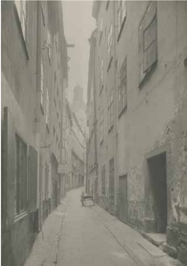
GÖRAN HÄLSINGES GRÄND FRÅN VÄSTER. PORTEN MED STENOMFATTNING TILL HÖGER LEDER TILL EURYDICE 3. F 29708.

Fastigheten fick sin nuvarande volym under 1600-talets andra hälft, men delar av stommen är sannolikt äldre än så. Det finns en utförlig beskrivning av byggnaden från 1748, då ägaren var glasmästaråldermannen Petter Stöver.