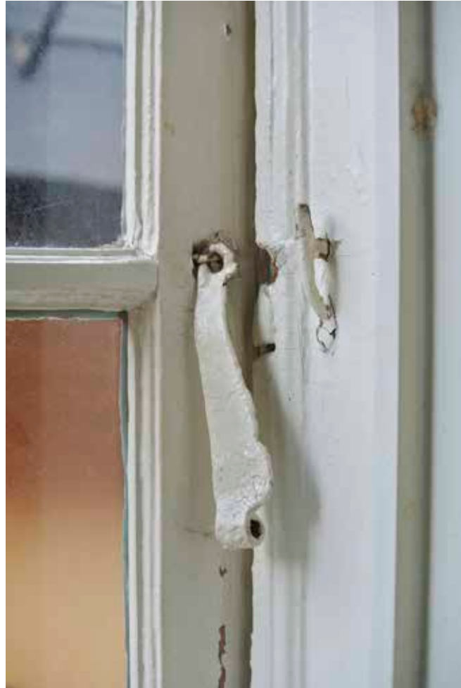
EN DÖRR MED FYRA UTANPÅLIGGANDE FYLLNINGAR HAR S-FORMADE GÅNGJÄRN FRÅN 1600-TALET.

fjärde våningen fanns en stor glasmästarverkstad som upptog hela den östra delen, med en murstock mitt i rummet. Västerut låg fyra kammare. Vinden hade en hissglugg åt varje gränd och små fönstergluggar i båda gavlarna. Överst låg en vind på hanbjälkarna.