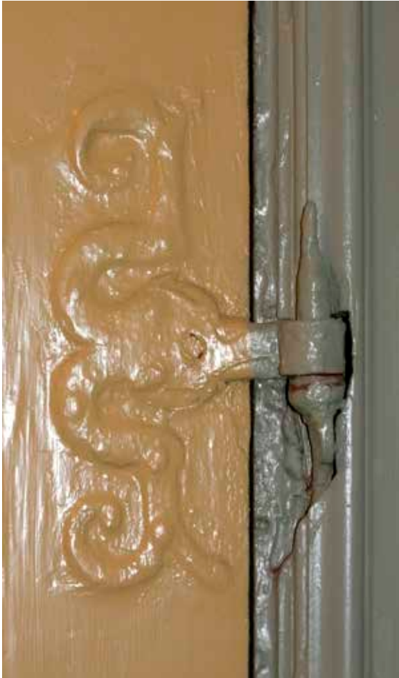
YTTERFÖNSTREN BEVARAR ÄLDRE BÄGAR, BESLAG OCH HASPAR, DE SENARE FRÅN 1700-TALET. FOTO: J. MALMBERG.