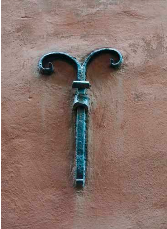
ANKARSLUTARNA FRÅN 1600-TALET VISAR ATT HUSET DÅ UPPFÖRDES TILL DAGENS HÖJD.