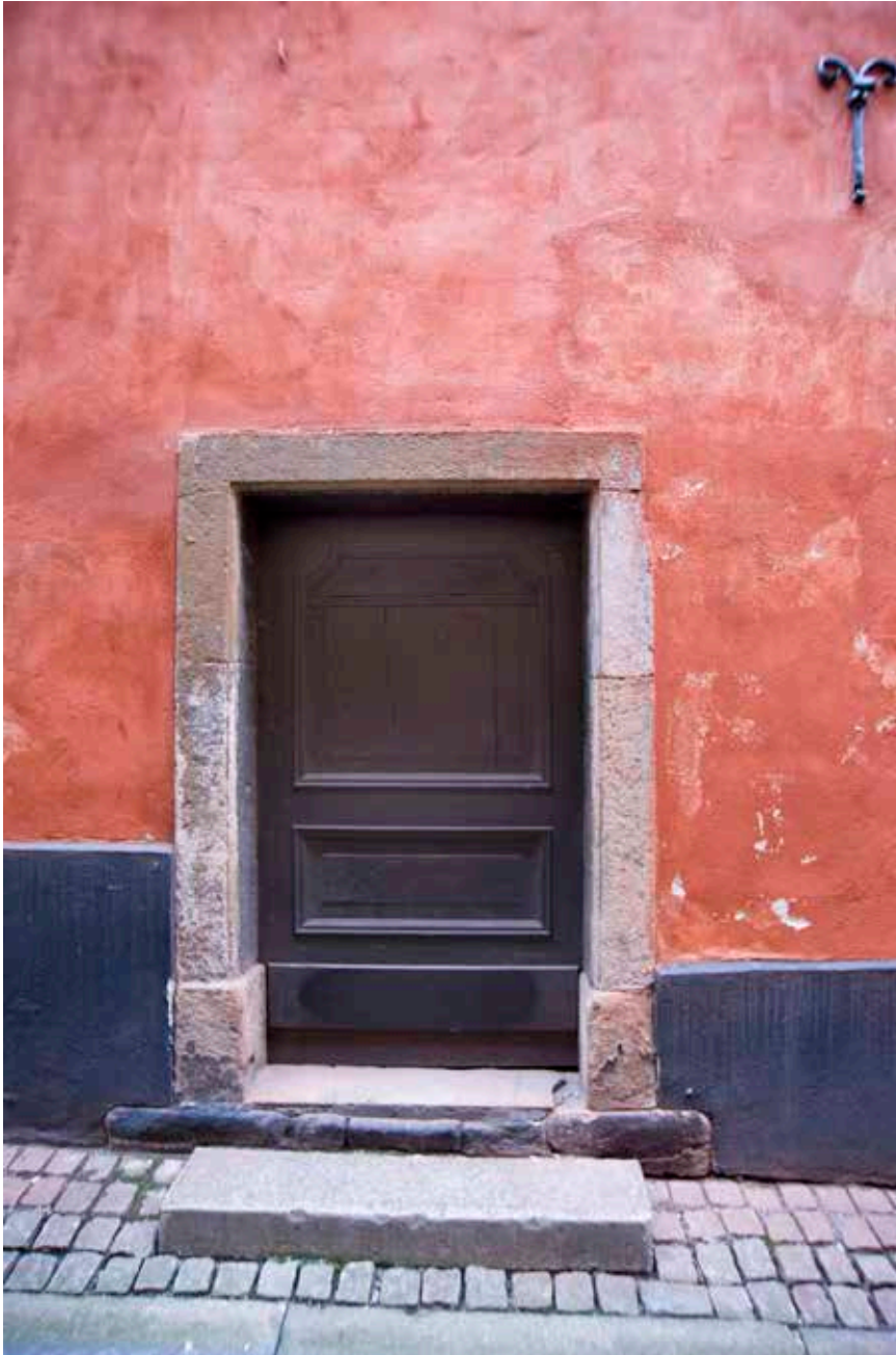
FRAM TILL 1900-TALET S SLUT HAR DETTA VARIT HUVUDINGÅNGEN TILL FASTIGHETEN, FRÅN GÖRAN HÄLSINGES GRÄND. FOTO: J. MALMBERG.

har varit goda exempel, inte minst de allra första insatserna som gjordes.