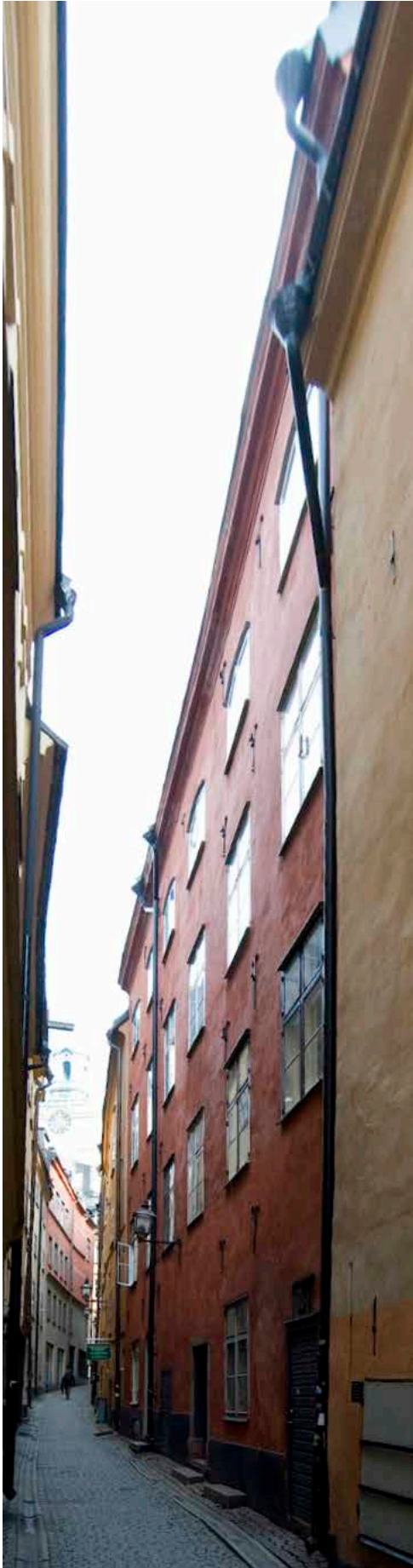
FASADEN MOT GÖRAN HÄLSINGES GRÄND SETT FRÅN STORA NYGATAN I VÄSTER.

nybyggda husen längs framför allt Nygatorna i väster till en reglerad stadsplan.