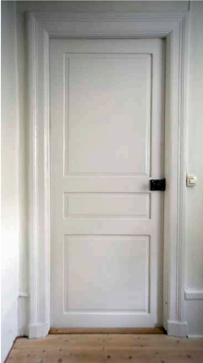
NÅGRA DÖRRBLAD MED FODER FRÅN 1800-TALET HAR BEVARATS, LIKSOM FOTPANELER.

var då som löpare (betjänt) hos änkedrottning Josefina. I huset bodde också ytterligare sex personer samt som det uppges några ”resande”: kyrkoherde Hallströms båda döttrar med sin jungfru.