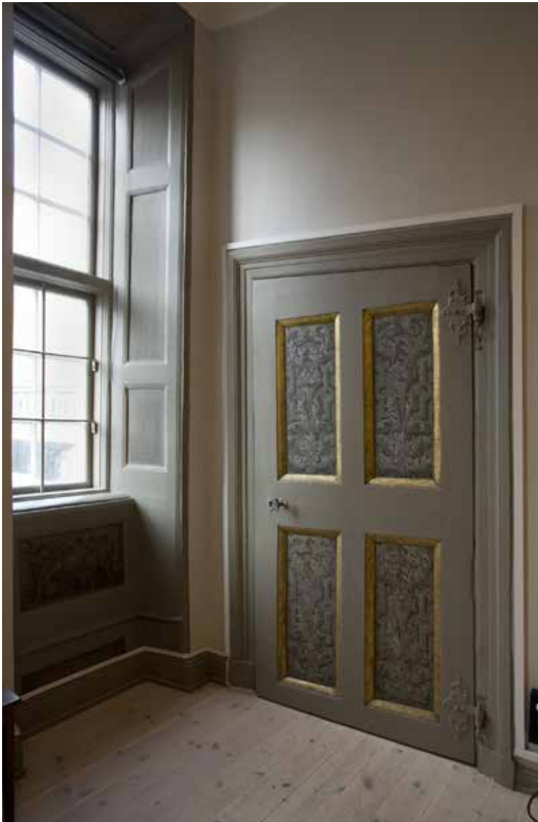
DÖRRBLAD OCH FÖNSTERBRÖSTPANEL HAR DEKORATIVA MÅLERIER FRÅN SENT 1600-TAL. LÄGG MÄRKE TILL DÖRRENS ÄLDERDOMLIGA GÅNGJÄRN.

betong. Den lilla trädgården fick dagens utseende efter renoveringen.