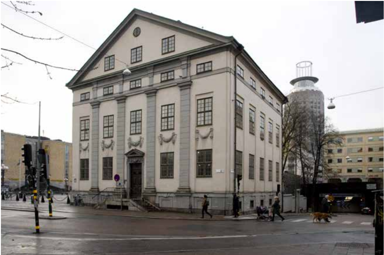
HUVUDFASADEN MOT GÖTGATAN ÄR DEN MEST UTSMYCKADE, MED FRUKTFESTONGER OCH PILASTRAR.