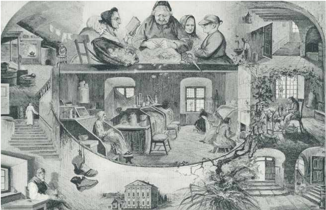
REPORTAGE FRÅN FATTIGHUSET 1881, BILD AV JENNY NYSTRÖM/I. WESTFELT. UR NY ILLUSTRERAD TIDSKRIFT. STADSMUSEETS ARKIV, FA 44872.

Byggnaden uppfördes under 1600-talets andra hälft med en exteriör i tidstypisk, holländsk klassicism. Ägare var handelsmannen Joakim Pötter, adlad Lillienhoff. Till fastigheten hörde, förutom den bevarade huvudbyggnaden, flera uthus och en stor trädgård som sträckte sig ner till sjön Fatburen i väster.