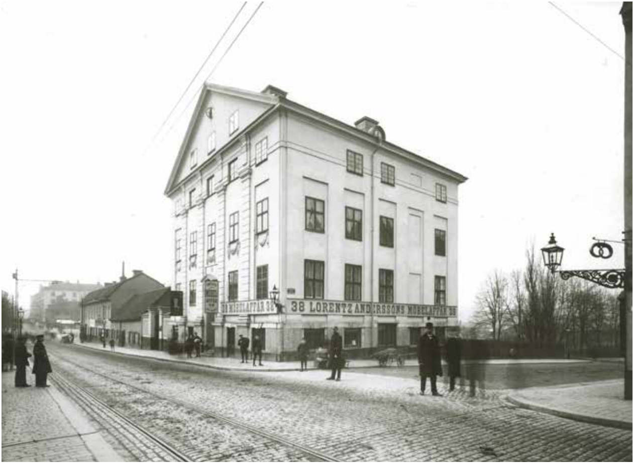
KRING 1900 VAR FRITRAPPAN BORTA, OCH FÖNSTERSÄTTNINGEN NÅGOT ANNAN ÄN IDAG. SÖDER OM PALATSET LÅG INKÖRSSPORTARNA TILL GÅRDEN, OCH VIDARE LÅNGS GÖTGATAN FLERA HUS. OKÄND FOTOGRAF KRING SEKELSKIFTET 1900. STADSMUSEETS ARKIV, FA 41088

sjön Fatburen, som fylldes igen. Intill anlades Södra bangårdstorget, som ombyggdes på 1930-talet och bytte namn till Medborgarplatsen. Vid samma tid anlades Södergatan, en stor genomfartsgata väster om torget, nedgrävd i ett djupt dike. På 1980-talet hade bangården tagits ur bruk och området byggdes om till bostäder. Samtidigt däckades Södergatan över och ingår nu i Söderledstunneln. Området norr om Medborgarplatsen består idag av en blandad bebyggelse från olika tidsperioder. Lägre 1700-talsbebyggelse blandas med höga, moderna kontorskomplex. Längs Götgatan ligger många butiker och caféer i husens bottenvåningar.