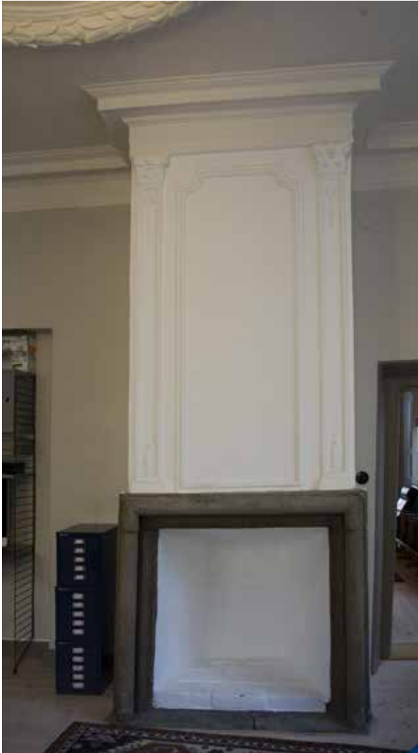
SPISEN MED SIN STENOMFATTNING TILLHÖR PARADVÅNINGENS SENBAROCKINREDNING, OCH STÅR DET NORRA AV RUMMEN MOT GÅRDEN.

I och med att Södra stambanan och Bangårdstorget anlades kring 1860 försvann en mycket stor del av fastighetens tomtmark. När torget anlades måste marknivån ha höjts, eftersom huvudbyggnaden därefter beskrevs i brandförsäkringarna som tre våningar hög i stället för de tidigare fyra. Den nedersta våningen hade blivit en souterrainvåning.