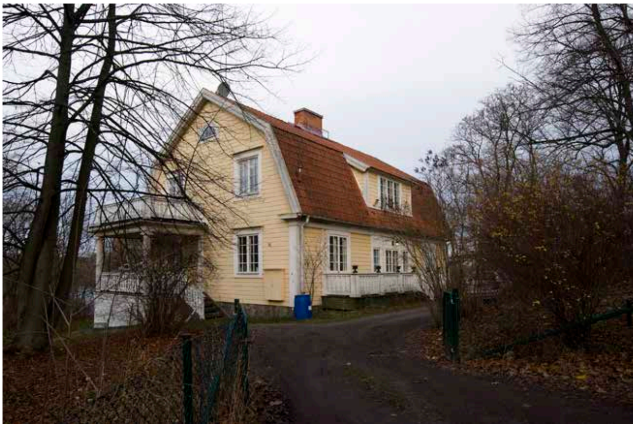
DIREKTÖRSVILLAN MED TIDSTYPISKT BRUTET TAK, PANELADE VÄGGAR OCH SMÅSPRÖJSADE FÖNSTER.

År 1914 uppfördes fängelsedirektörens villa på Långholmen. Huset byggdes enligt rådande arkitekturideal med förebilder inom både nationalromantiken och jugend. Byggnaden speglar de välbärgades bostadsförhållanden under 1910-talet och bevarar interiörer från denna tid.