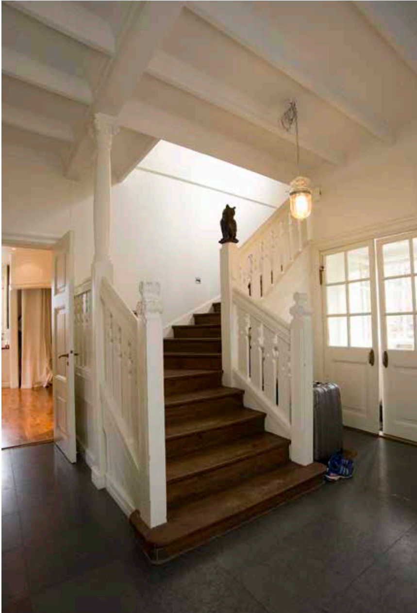
TRAPPHALL MED URSPRUNGLIG TRAPPA, PARDÖRRAR OCH KASSETTAK. TRAPPAN HAR FIGURSÅGADE OCH DEKORATIVT UTSMYCKADE RÄCKEN. GOLVET ÄR FRÅN RENOVERINGEN ÅR 2003.

tillbyggnader av fängelsemiljön. Till denna hör även ett flertal byggnader utanför fängelsemurarna som används som bostäder.