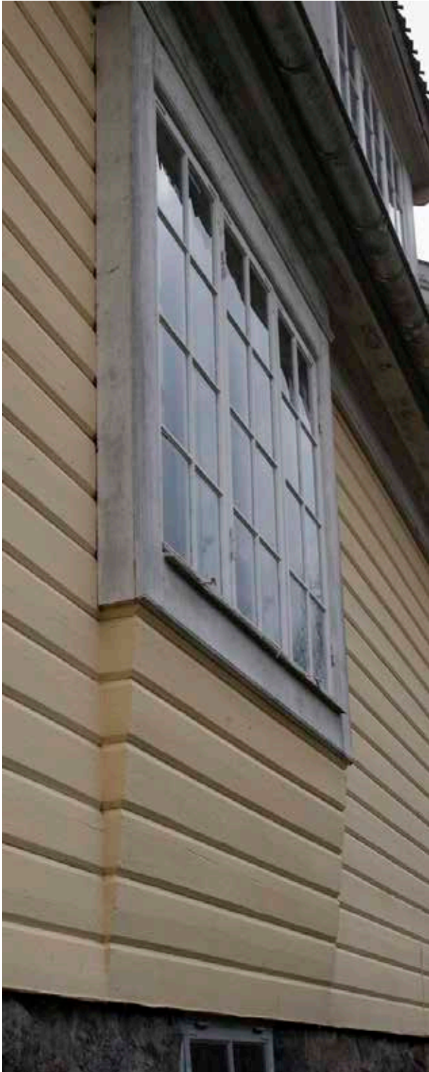
DETALJ ÖVER ETT AV HUSETS NÄTTA BURSPRÅK.

trappan som var centralt placerad i huset, fanns även en tjänstetrappa mellan köket och jungfrukammaren en trappa upp. Från köket gick en serveringsgång till matsalen. Köket som sköttes av tjänstefolk var litet och troligtvis enkelt utrustat.