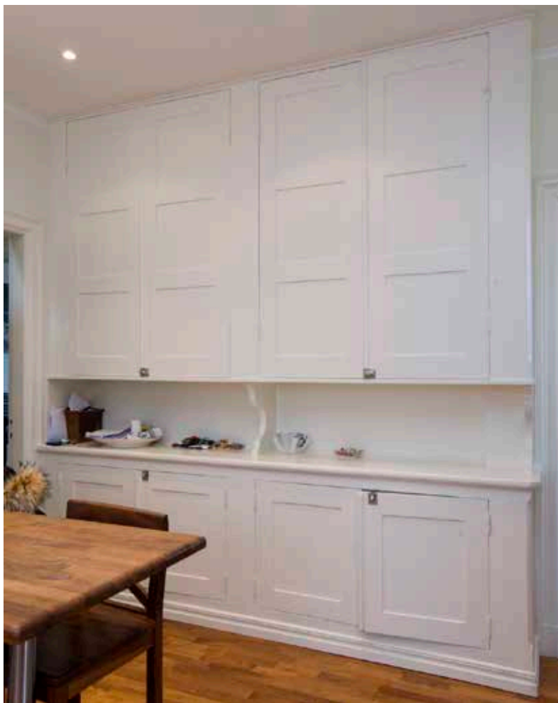
URSPRUNGLIGT SERVERINGSSKÅP.

Knäpersta och Sjötullen nyttjades som bostäder för fängelsepersonalen. I magasinbyggnaden inreddes bostäder för 14 vaktkonstaplar med sina familjer. Direktörens bostad var placerad i Ahlstedtska husets övre våning men flyttades 1914-1915 till den nybyggda direktörsvillan.