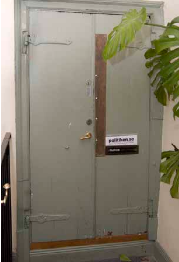
INSIDA AV PARDÖRR MED ÄLDRE GÅNGJÄRN.