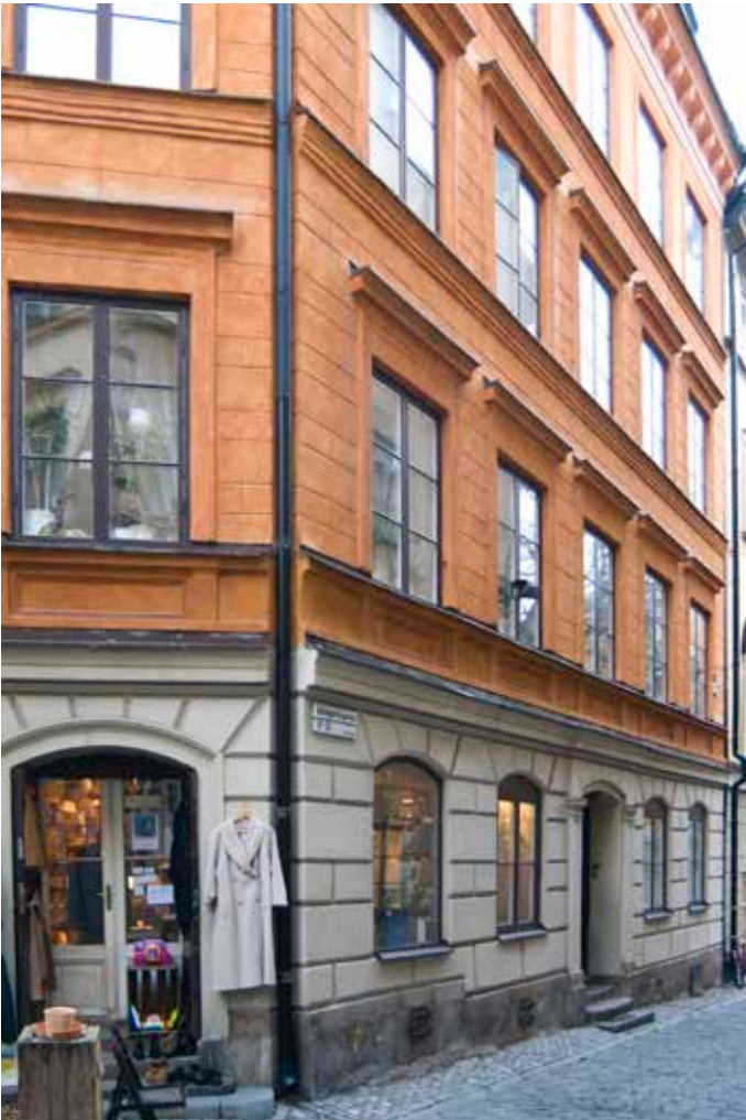
FASADEN MOT SJÄLAGÅRD SGATAN HAR EN PUTSUTSMYCKNING MED RUSTICERINGAR OCH LISTVERK FRÅN 1860-TALET.

flera nybyggen men också modernisering av de äldre husen. Byggnaderna fick stora vindar i flera våningar med höga, branta tak och ofta en dekorativ fasadutsmyckning i natursten. Samtidigt anpassades de nybyggda husen längs framför allt Nygatorna i väster till en reglerad stadsplan.