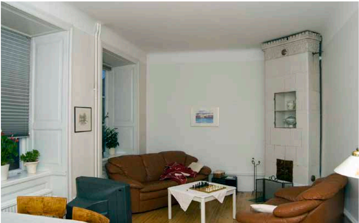
SNICKERIER I FORM AV FOTPANEL OCH FÖNSTERMYGPANEL SAMT EN VIT KAKELUGN, SAMTLIGA FRÅN 1800-TALET.