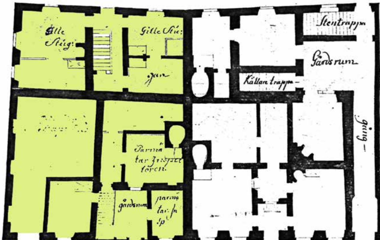
"GAMLA AUKTIONSHUSET OCH GILSTUGAN VID TYSKA BRUNNEN". UPPMÄTNINGSRITNING AV J. E. CARLBERG 1761. CUPIDO 4 HAR HÄR MARKERAT MED GULT. ORIGINAL I STOCKHOLMS STADSARKIV.

På den östra sidan av tomten, med långsida längs Baggensgatan, står en byggnad som bevarar medeltida murverk till tre våningars höjd mot gatan och fyra mot gården.