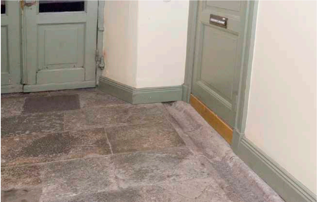
I BYGGNADEN MOT BAGGENSGATAN FINNS EN RÄNNA AVSEDD ATT LEDA VATTEN FRÅN GÅRDEN TILL GATAN.

och utformning som den fortfarande har. På 1930-talet disponerade polisen våning 1 trappa upp och murgenombrott gjordes till polisstationen i grannhuset Cupido 3. Fastigheten förvärvades av Stadsholmen 1957.