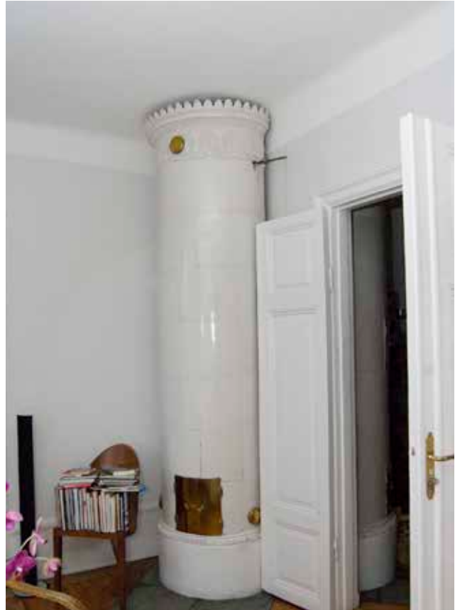
I RUMMET FINNS INREDNING FRÅN 1800-TALET I FORM AV EN RUND VIT KAKELUGN, PARDÖRRAR OCH FOTPANEL.