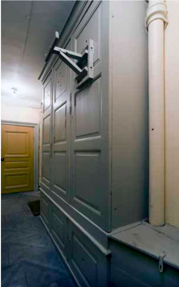
TRAPPHUSET INOM TYSKA BRINKEN 22 KAN VISA UPP DÖRRBLAD OCH DÖRRFODER FRÅN OMBYGGNADEN 1770, MEN OCKSÅ ETT VÄGGFAST SKÅP SAMT VEDLÅR FRÅN 1800-TALET'S ANDRA HÄLFT.