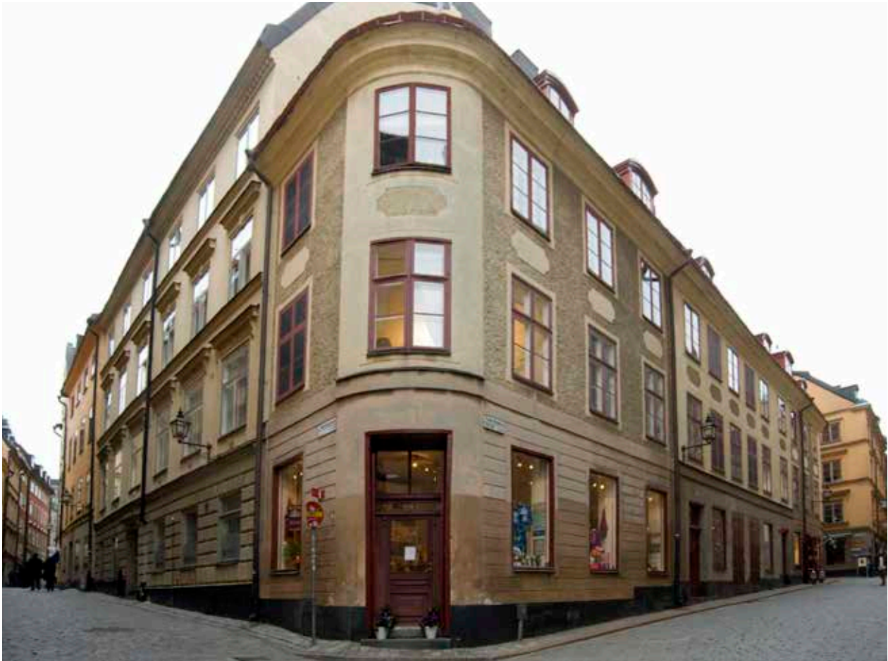
CERES 16 SETT FRÅN TYSKA BRINKEN VISAR MED SINA RUNDADE HÖRN OCH OMVÄXLANDE PUTSDEKOR ETT TYPISKT EXEMPEL PÅ EN ROKOKOFASAD.

kvarteret Cepheus och flera av de genomförda renoveringarna har varit goda exempel, inte minst de allra första insatserna som gjordes.