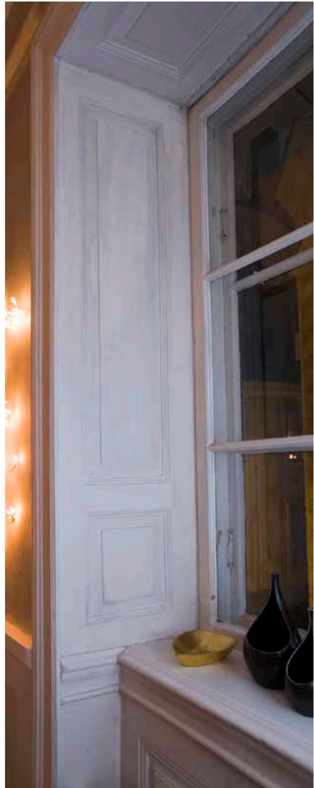
FÖNSTERSMYGPANELER, FÖNSTERBRÖSTPANEL OCH BRÖSTPANEL FRÅN OMBYGGNADEN 1770. I DE YTTRE FÖNSTERBÅGARNAS SKYMTAR SAMTIDA HASPAR.

Portgångarna och trapploppens vilplan har golv av kalksten. I den östra portgången finns en hög pärlspontpanel från 1800-talets slut och kryssvälvttak. En dörr med överljusfönster och tärningar i spröjskorsen leder till den lilla gården. Trapporna är av sten från källarna till de nedre vindarna. Till hanbjälksvindarna leder en trätrappa i väster och en tegeltrappa i öster. Lägenhetsdörrarna är helfranska med rokokofoder. På vilplanen i det östra trapploppet finns stora, väggfasta skåp från den senare delen av 1800-talet. Trapphusens fönster har äldre bågar med tärningar i spröjskorsen och äldre hakar. Vid ett fönster finns ett smitt järngaller. I lägenheterna finns många exempel på fast inredning bevarad sedan 1770, till exempel dörrblad med knoppgångjärn, dörr- och fönsterfoder, bröst- och fönstersmygpaneler, markerade takspeglar med nupna hörn och murade spisar. Även 1800-talet är representerat i form av kakelugnar, både från seklets förra och senare hälft, samt takrosetter. Vid en inventering 1984 noterades en renässansdörr från omkring år 1600 på den västra vinden.