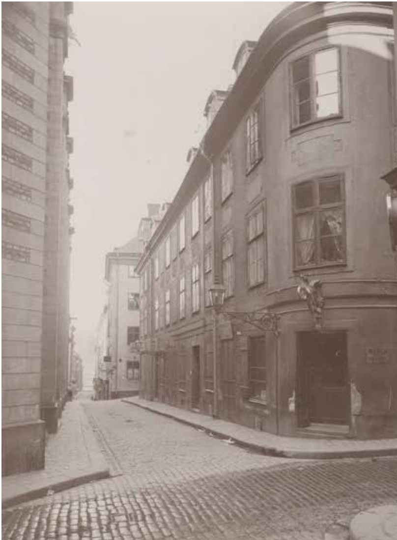
CERES 16 ÅR 1905. DEN NÄRMASTE BUTIKEN SÄLJER MJÖLK OCH GRÄDDE, OVANFÖR PORTEN SITTER EN KRINGLA SOM HÅLLS AV EN ORM, TEXTEN KONDITORI KAN URSKILJAS. OKÄND FOTOGRAF, STADSMUSEETS ARKIV, 466.

Med sina rundade hörn och omväxlande fasad är fastigheten Ceres 16 en av de mest typiska rokokobyggnaderna i Gamla stan. Stommen består av tre äldre hus och i källarna har medeltida murverk dokumenterats.