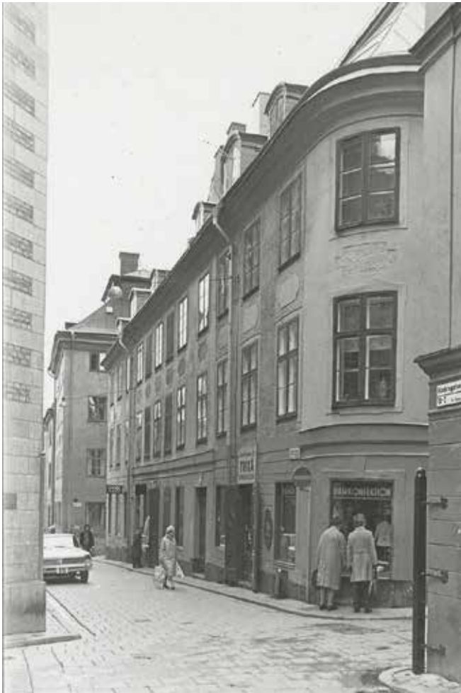
PÅ 1970-TALET LÅG EN TRIKÅ- OCH DAMKONFEKTIONSAFFÄR I HÖRNET TYSKA BRINKEN/SVARTMANGATAN. DEN DÖRRÖPPNING SOM FANNS PÅ HÖRNET 1905 HADE ERSATTS AV ETT FÖNSTER. FOTO: G. FREDRIKSSON, 1972, STADSMUSEETS ARKIV, FA 7754.

Det expansiva 1600-talet, när Sverige utvecklades till en stormakt, gav en annan prägel åt staden med flera nybyggen men också modernisering av de äldre husen. Byggnaderna fick stora vindar i flera våningar med höga, branta tak och ofta en dekorativ fasadutsmückning i natursten. Samtidigt anpassades de nybyggda husen längs framför allt Nygatorna i väster till en reglerad stadsplan.