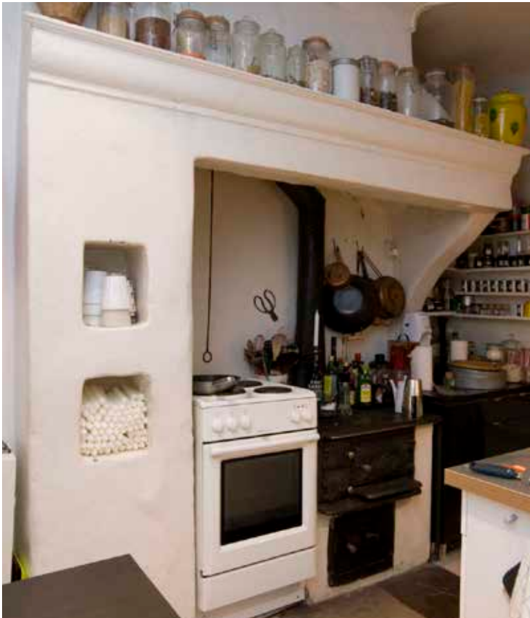
HÄR FINNS SPISAR FRÅN TRE TIDSPERIODER. DEN VACKRA, MURADE SPISEN MED SIN NISCHER ÄR FRÅN 1770. INOM DEN STÅR DELS EN ÄLDRE JÄRNSPIS, DELS EN MODERN SPIS.

1888 var tre bokhållare listade på adressen Tyska Brinken 20 och en hattmakare på nr 22. Vid sekelskiftet 1900 var handlaren J P Lindberg den enda affärsinnehavaren, men några år senare fanns där även ett skrädveri och en glas- och porslinshandel. I Stadsmuseets samlingar finns flera föremål från en trikå- och manufakturaffär med adressen Tyska Brinken 20 och en hel del interiörfotografier från en sytillbehörsaffär vid Tyska Brinken 22.