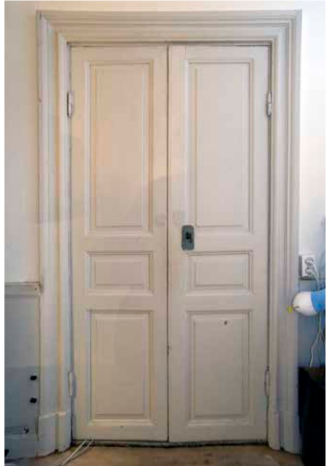
I LÄGENHETERNA HAR HELFRANSKA PARDÖRRAR FRÅN 1770 BEVARATS, MED SAMTIDA FODER OCH KNOPPGÅNGJÄRN.

mer utrymme eller ”körväg” till kyrkan, förmodligen av brandskyddsskäl.