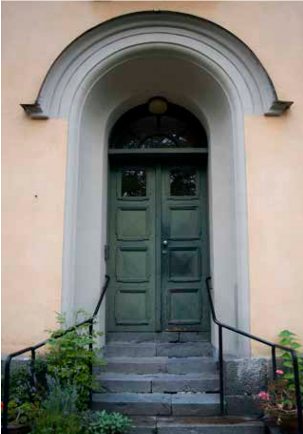
HUVUDENTRÉN MED RUNDBÅGIG PORTAL OCH HELFRANSKA PARDÖRRAR.