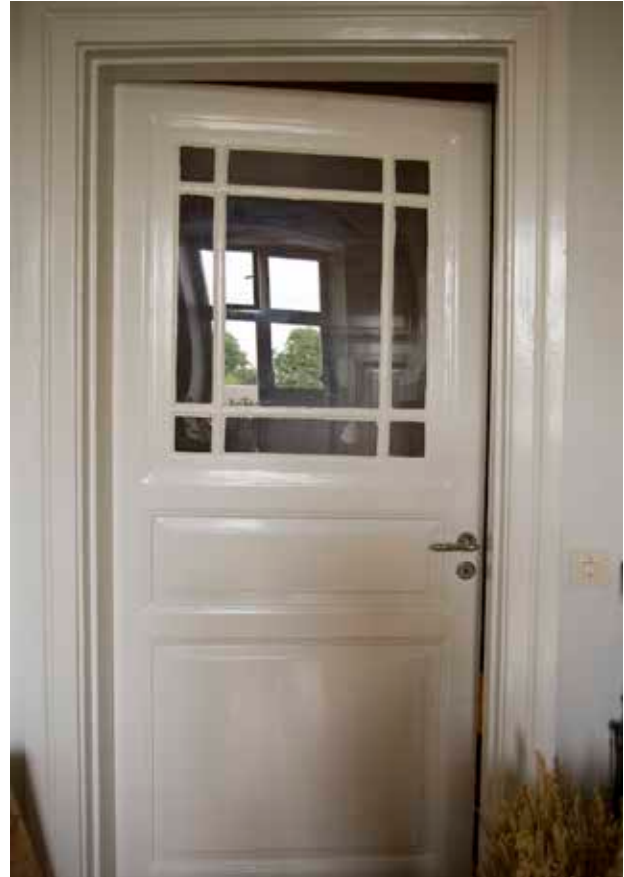
DÖRR FRÅN SENT 1800-TAL MED GLASAD ÖVRE FYLNING.

central vaktlokal och kamrerarekontor. Byggnaden kom att benämnas Tjänstemannabostadshuset. Idag nyttjas de två nedre våningarna som daghem. På den inredda vinden finns två lägenheter. Fastigheten förvärvades av AB Stadsholmen 1979 och renoverades på 1980-talet. Den nya funktionen som daghem innebar att planlösningarna till viss del förändrades i dessa våningar. Ett mål var att äldre snickerier och takstuckatur i möjligaste mån skulle bevaras. Renoveringen skedde i samarbete med Stadsmuseet.