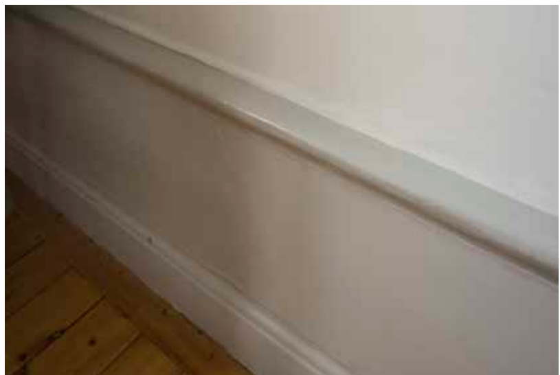
FOTPANEL SOM FÖRMODLIGEN ÄR FRÅN UPPFÖRANDET PÅ 1850-TALET.