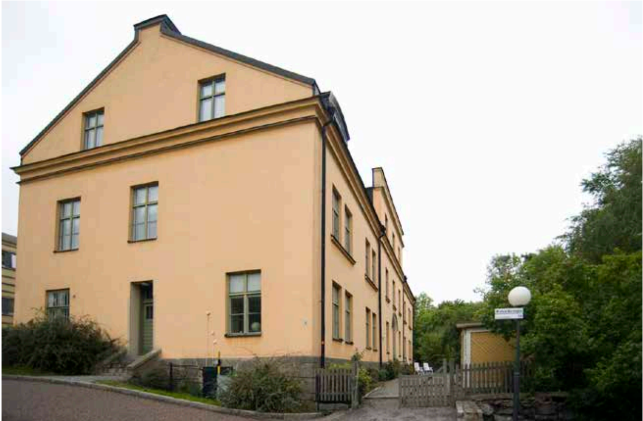
CENTRALVAKTEN HAR ETT BETONAT MITTPARTI OVANFÖR HUVUDENTRÉN TILL HÖGER I BILD.