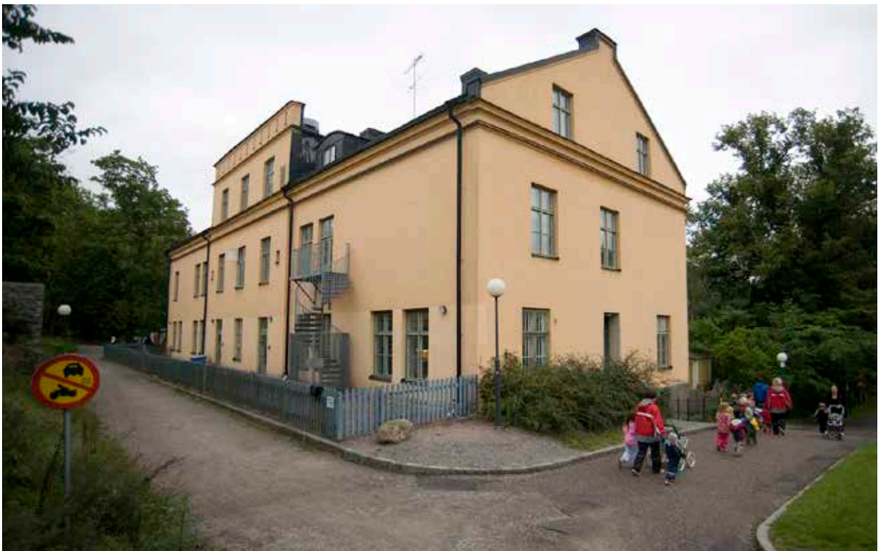
BYGGANDENS BAKSIDA HAR LIKSOM FRAMSIDAN ETT BETONAT MITTPARTI.