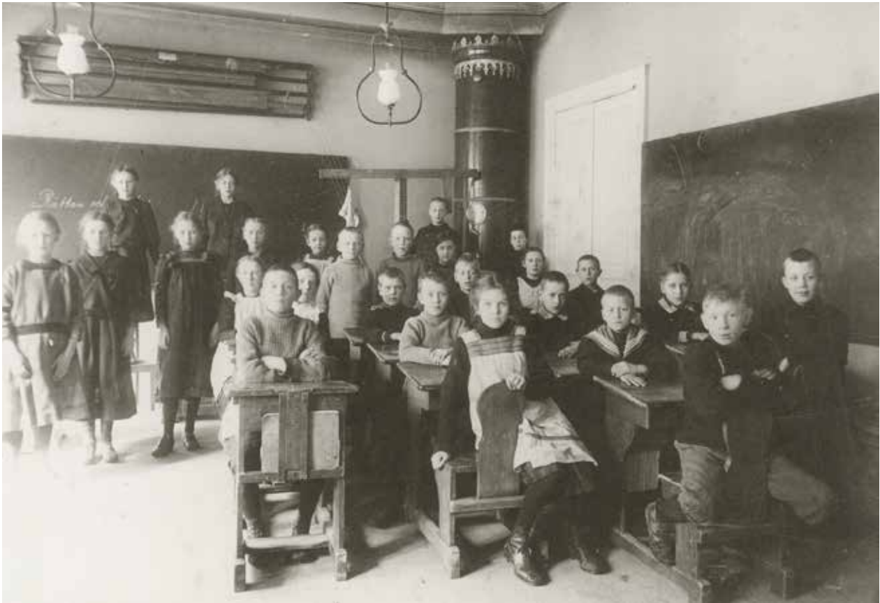
SKOLKLASS.

Den norra delen av gathuset kan följas i de skriftliga källorna tillbaka till medeltiden, då byggnaden var i riksföreståndaren Svante Nilsson Stures ägo. Källarvåningen är väl bevarad sen denna tid.