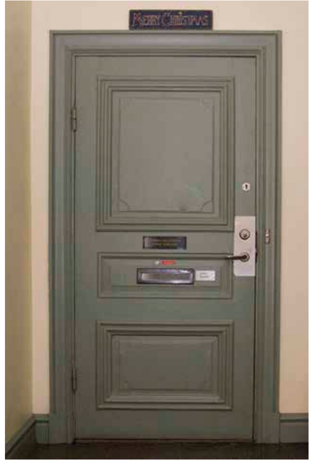
HELFRANSK ENKELDÖRR FRÅN 1700-TALET MITT. Fyllningarna har nupna hörn.

och flygeln blev konstnärateljé. På 1950-talet hade två konstnärateljéer inrättats i gathusets vindsvåning. De kakelugnar som fortfarande fanns under skoltiden revs. Förändringar skedde 1979 då bland annat flygeln gjordes om till ateljéer. En genomgång till grannfastigheterna anordnades då i flygelns västra del. Fasaderna renoverades på 1990-talet.