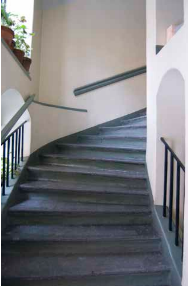
TRAPPLOPPET MED TRAPPA AV KALKSTEN.