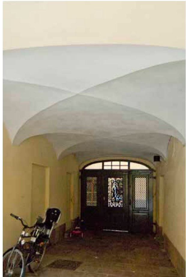
KÖRPORTENS KRYSSVALV SETT MOT GATAN.

uthus av sten byggdes vid den norra tomtgränsen senare under 1700-talet (de delar som är bevarade är markerade med Nr 4 på kartan).