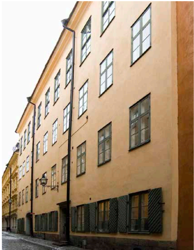
GATHUSETS FASAD MOT SJÄLAGÅRD SGATAN.

Under senare delen av 1800-talet försköts stadens centrum till Norrmalm. Gamla stan började att successivt förslummas och många diskussioner fördes om stadsdelens sanitära förhållanden. Det kom till och med förslag om att riva stora delar och bygga helt nytt. När de nya stadsdelarna på malmarna växte fram omkring 1900 blev problemen i Gamla stan ännu mer uppenbara, men de enskilda fastighetsägarna var inte villiga att bekosta saneringarna. Samfundet S:t Erik – som bildades 1901 och arbetade för att väcka intresse för stadens kulturhistoriskt värdefulla miljöer – oroades för stadsdelens fram-