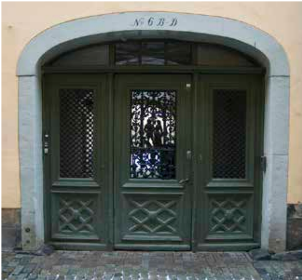
KÖRPORTEN IN TILL GÅRDEN HAR EN TREDELAD PORT MED HELFRANSKA SNICKERIER OCH DEKORATIVT GJUTJÄRNSGALLER FRÅN 1800-TALET'S MITT ELLER ANDRA HÄLFT.