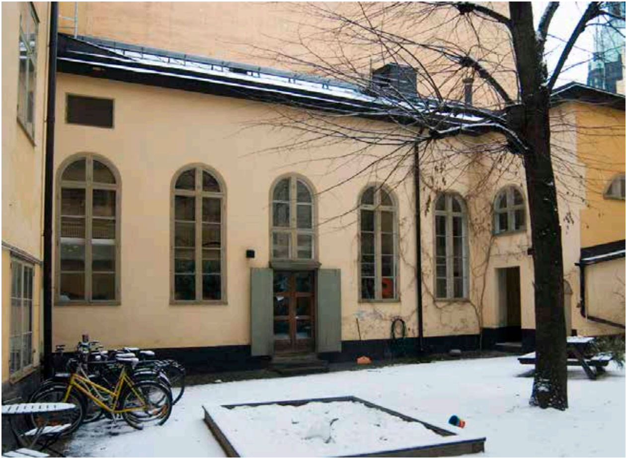
DEN SÖDRA GÅRDSFLYGELN ANVÄNDS SOM ATELJÉ MEN HAR TIDIGARE VARIT GYMNASIKSAL.

tid och tog på 1930-talet initiativet till att bilda AB Stadsholmen. Det nya bolaget fick i uppdrag att förvärva, restaurera och modernisera bebyggelsen med hänsyn bland annat till kulturhistoriska värden. De första åtgärderna i stor skala genomfördes i kvarteret Cepheus och flera av de genomförda renoveringarna har varit goda exempel, inte minst de allra första insatserna som gjordes.