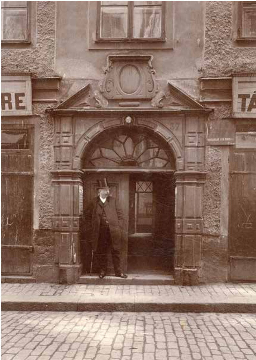
ENTRÉN TILL CALLISTO 3 ÅR 1891. PÅ FOTOT BEHÅLLER BOTTENVÅNINGEN DEN GAMLA, GROVA PUTSEN OCH PÅ VAR SIDA OM PORTALEN FINNS ENTRÉER TILL BUTIKER ELLER VERKSAMHETER, PÅ BILDEN TILLSTÄNGDA. ÄVEN FÖR BUTIKSFÖNSTREN SATT LUCKOR. PORTENS PARDÖRRAR OCH GLASADE ÖVERSTYCKE ÄR FRÅN TIDIGT 1800-TAL. FOTO KASPER SALIN, SSM F99883.

Callisto 3 är en fastighet som under den svenska stormaktstidens ökade välstånd bebyggdes med ett påkostat hus. Många av byggherrarna var, liksom byggherren till Callisto 3, handelsmän av utländsk härkomst.