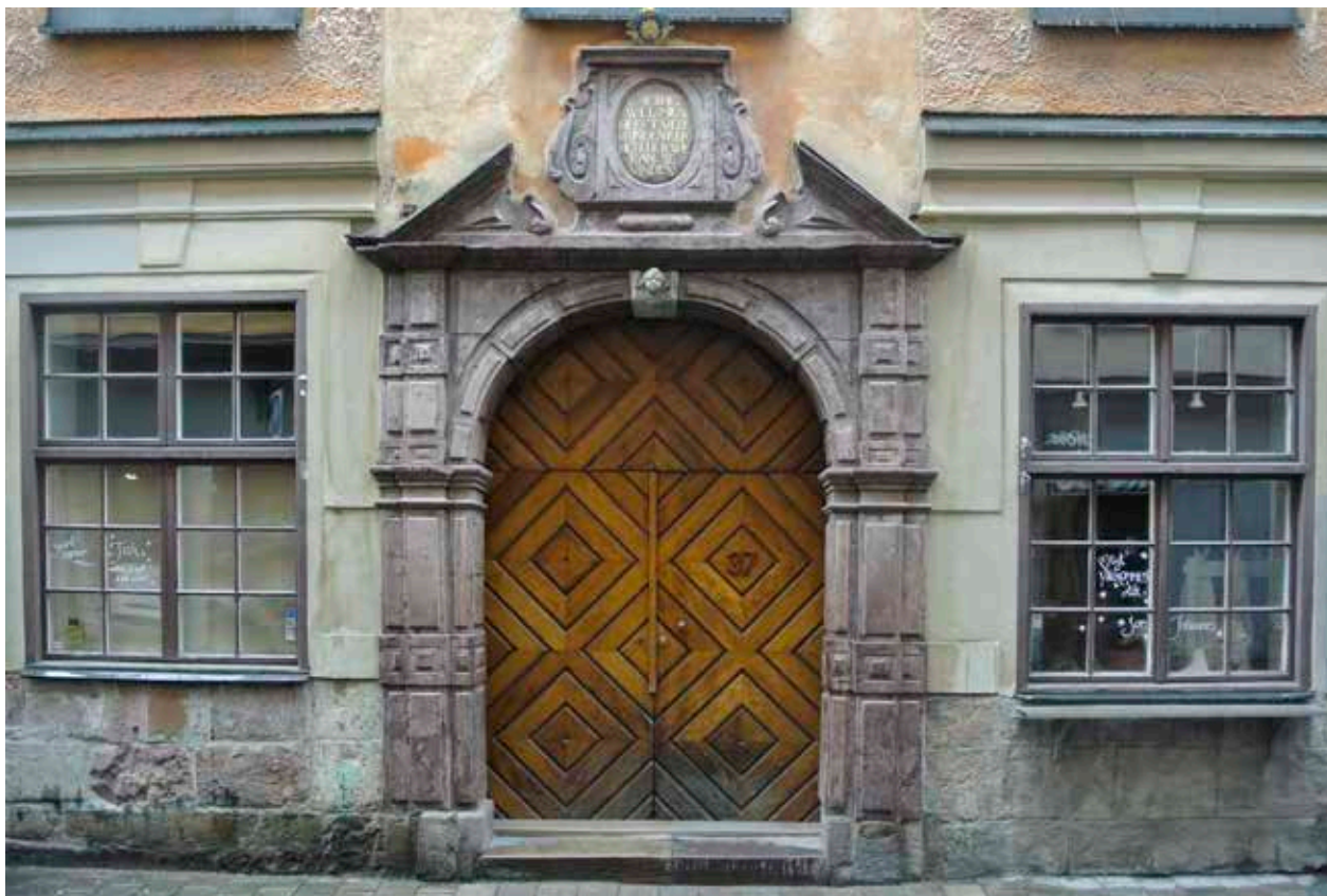
PORTALEN ÄR BEVARAD FRÅN 1662. DEN SLÄTPUTSADE BOTTENVÅNINGEN FICK DAGENS UTSEENDE PÅ 1960-TALET.

och taken flackare. Fasaderna utfördes släta och putsade, och rummen inreddes med kakelugnar och snickerier som till stor del finns bevarade i dag.