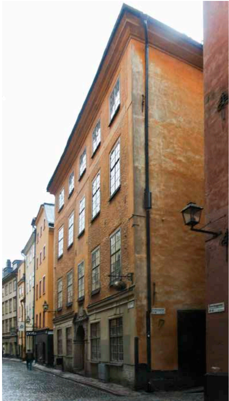
HUSETS FASAD MOT ÖSTERLÅNGGATAN OCH HÖRNET MOT PELIKANSGRÄND.