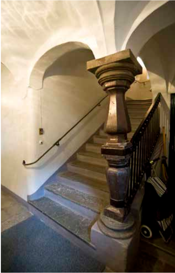
DEN BALUSTERFORMADE STENKOLONNEN ÄR KARAKTÄRISTISK FÖR PORTGÅNGEN, SOM TILLSAMMANS MED TRAPPHUSETS NEDRE DEL ÄR BEVARAD FRÅN 1660-TALET.