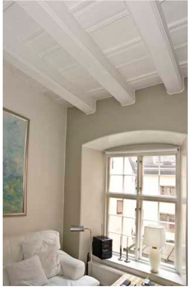
I FLERA AV LÄGENHETERNA BEVARAS BJÄLKTAKEN SYNLIKA.

karaktistiska långsmala kvarter, liksom kvarteret Callisto.