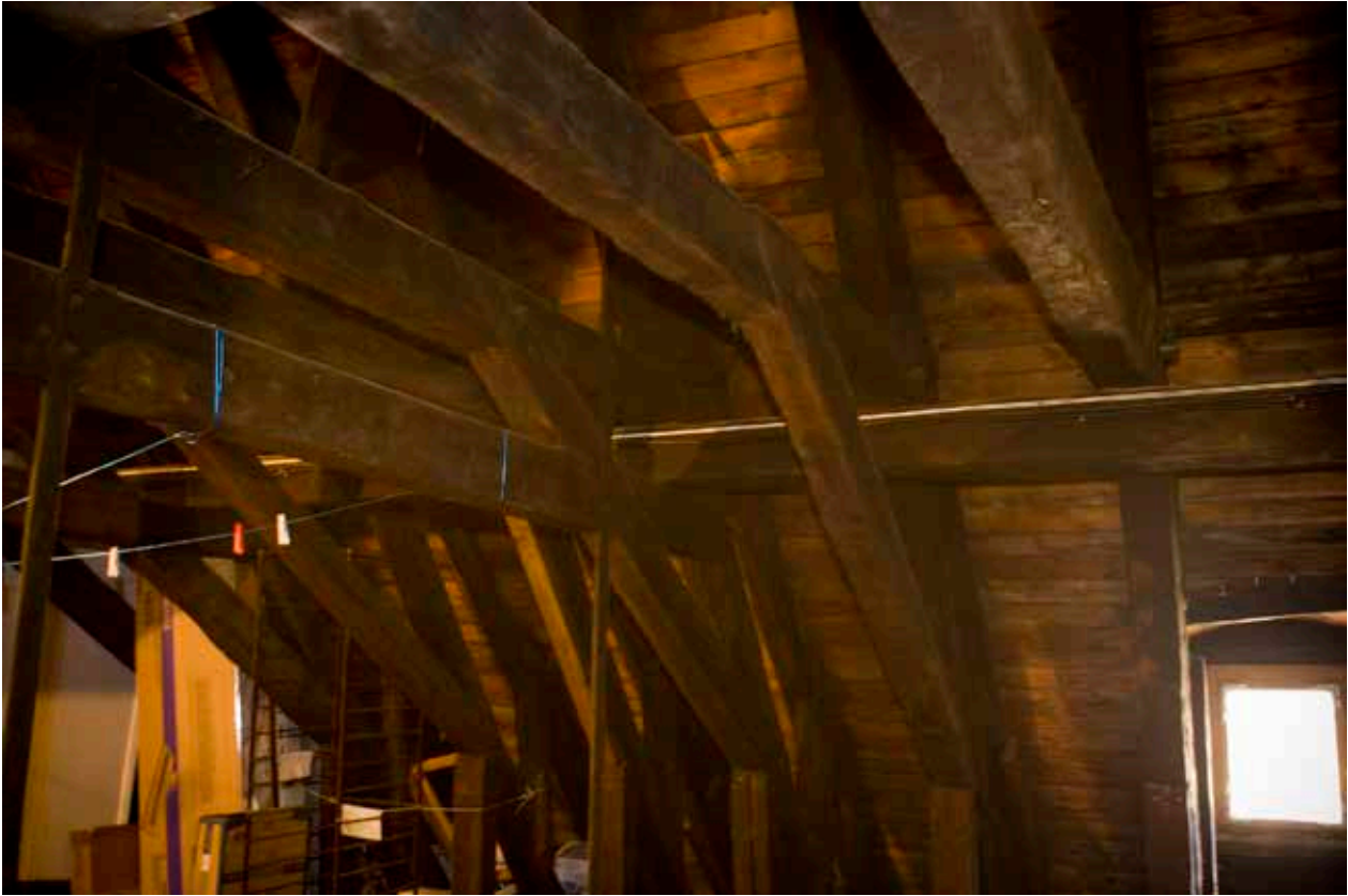
ÄVEN TAKSTOLSKONSTRUKTIONEN, SOM BÄR UPP ETT HÖGT, VALMAT SADELTAK, ÄR BEVARAD FRÅN BYGGÅRET OCH BIDRAR TILL FASTIGHETENS SÄRSTÄLLNING.

valv och sin balusterliknande kolonn av röd, huggen sandsten har genom åren behållits från Bruyns hus. De på 1600-talet större rummen hade målade bjälktak samt väggmålningar upp till bröstningshöjd som imiterade träpanel. Målade bjälktak med profilerade bjälkar och mellanliggande profilerad panel har i samband med renoveringar hittats på samtliga våningsplan ovan bottenvåningen. Ett av dessa tak hade motivmålningar i form av dekorativa bladverk i gråtoner, de övriga var vitmålade med växelvis rött och blått på profilerna. Även resterna av en väggmålning med motiv av bröstpanel, dekorerad med bladverk och frukter i fyllningarna, har påträffats. Det har dessutom konstaterats att 1600-talets murade mellanväggar var uppförda av gult, holländskt tegel.