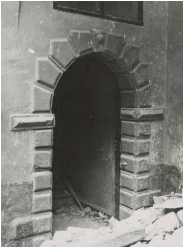
PORTAL MOT GÅRDEN I DEN RIVNA BEBYGGELSEN, VILKEN INSPIRERAT UTFORMNINGEN AV PORTALERNA VID NORRA DRYCKESGRÄND. OKÄND FOTOGRAF ÅR 1939. SSM:S ARKIV F 22266.

Vid 1800-talets senare del och under tidigt 1900-tal fick många byggnader fasader med tidstypiska dekorer i stuck eller puts och bottenvåningarna gjordes ofta om till butiksfasader med stora skyltfönster.