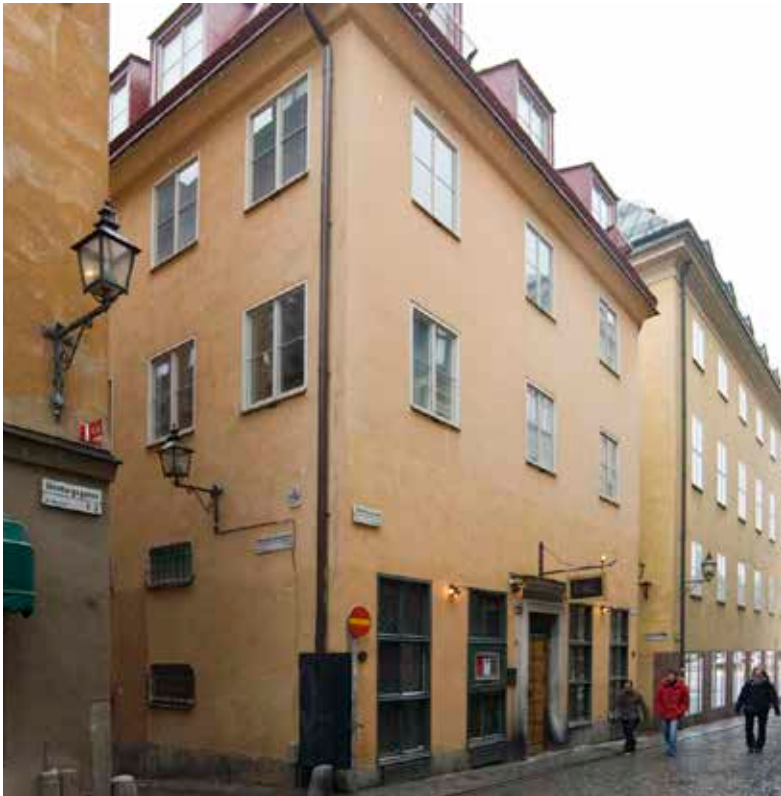
EXTERIÖREN HAR UTFORMATS FÖR ATT PASSA IN MED DEN OMGIVANDE ÄLDRE BEBYGGELSEN. FASADERNA ÄR SLÄTPUTSADE, TAKLISTERNA PROFILERADE OCH TAKEN PLÅTKLÄDDA.

Byggnaden uppfördes 1939-1940 i samband med att den äldre bebyggelsen på tomten revs. Avsikten var att det nya huset till det yttre skulle samstämma med den omgivande, ålderdomliga bebyggelsen.