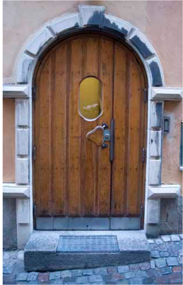
TVÅ LIKADANA SANDSTENSportaler finns mot Norra Dryckesgränd. Deras utformning har inspirerats av en 1600-talsportal som tidigare satt mot gården i den gamla huvudbyggnaden.