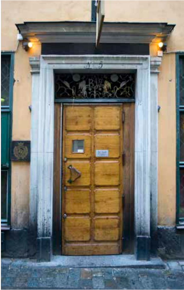
SANDSTENSPORTALEN MOT JÄRNTORGSGATAN ÄR EN KOPIA AV DEN 1700-TALSportal som tidigare fanns på samma plats. Porten är av ek med tio utanpåliggande fyllningar. Ovanför dörren finns ett överljusfönster med en dekor av växter, putti och initialerna B W (Bacchi Wapen) i smidesjärn.