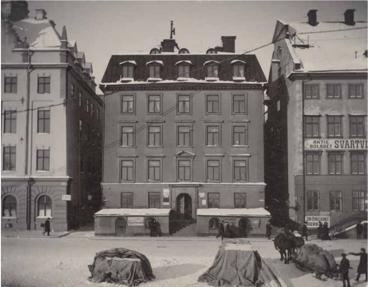
FRAM TILL 1929 LÅG TVÅ SALUBODAR VID SKEPPSBRON. OKÄND FOTOGRAF, TAGET FÖRE 1929. SSM:S ARKIV, A 22/43.

Fastigheten är en del av den mäktiga Skeppsbroraden, som genom centralmaktens direktiv byggdes för att manifestera Sverige som stormakt på 1600-talet. Härifrån leddes utvecklingen av staden näringsliv i flera århundraden.