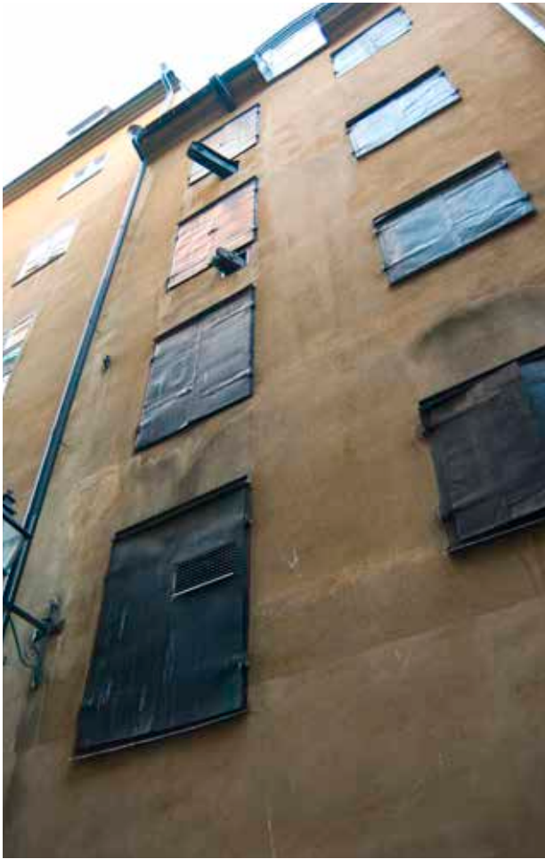
MAGASINSBYGGNADENS FASAD MED FLERA HISSBOMMAR OCH PLÅTKLÄDDA LUCKOR.