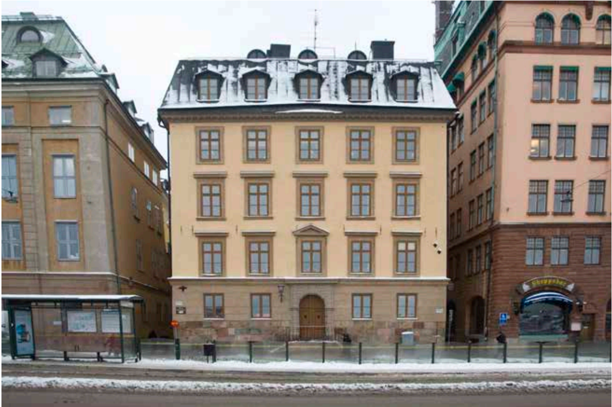
FASAD MOT SKEPPSBRON.