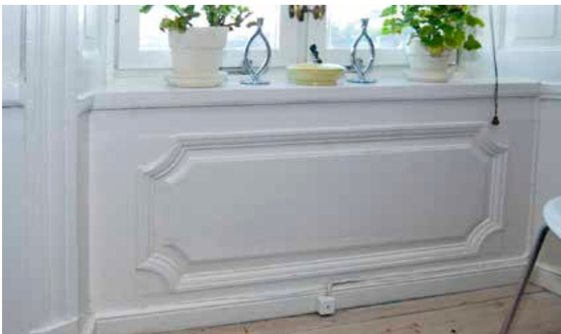
HELFRANSK FÖNSTERBRÖSTPANEL AV BAROCKTYP, FÖRMODLIGEN FRÅN SENT 1600-TAL.

Hälften av den norra flygeln och ett förrådshus på tomtens västra del revs 1786 för en nybyggnad av ett magasinshus som ännu står i stort sett orört på tomten. Byggnaden hade källare, murade väggar, fyra magasinbottnar och vind med brandbotten samt trätrappa och yttertak täckt med tegel och järnplåtar.