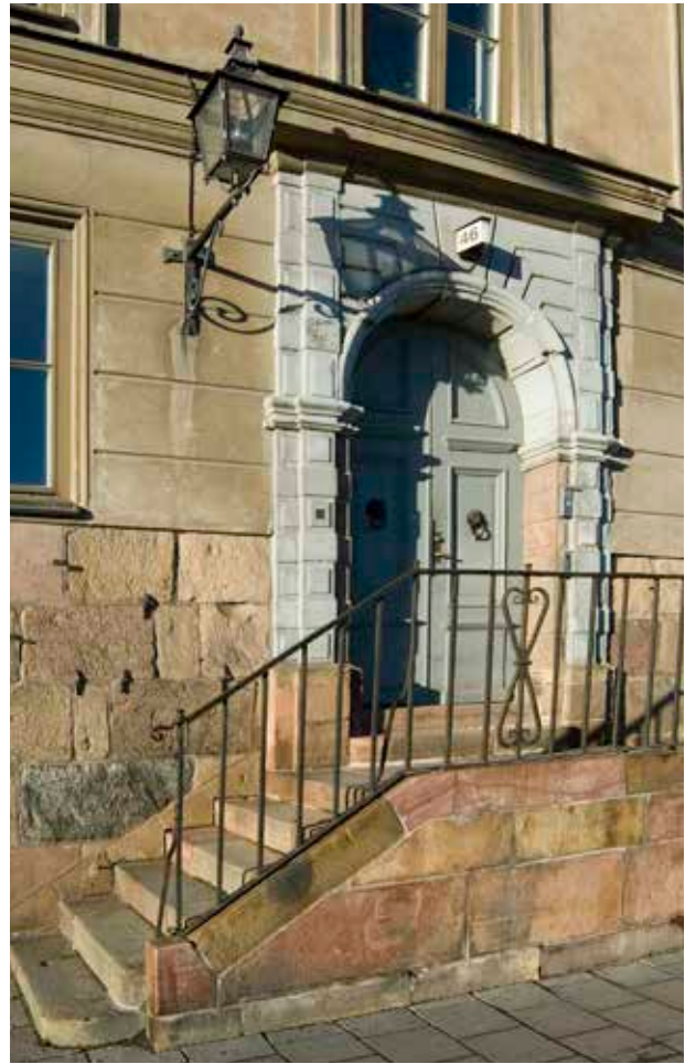
PORTALEN ÄR HUVUDSAKLIGEN FRÅN 1600-TALET. PORTEN ÄR EN HELFRANSK PARDÖRR FRÅN 1700-TALETS FÖRRA HÄLFT. PORTKLAPPARNA UTGÖRS AV LEJONMASKER MED RINGAR I GAPEN.

tade för att väcka intresse för stadens kulturhistoriskt värdefulla miljöer – oroades för stadsdelens framtid och tog på 1930-talet initiativet till att bilda AB Stadsholmen. Det nya bolaget fick i uppdrag att förvärva, restaurera och modernisera bebyggelsen med hänsyn bland annat till kulturhistoriska värden. De första åtgärderna i stor skala genomfördes i kvarteret Cepheus och flera av de genomförda renoveringarna har varit goda exempel, inte minst de allra första insatserna som gjordes.