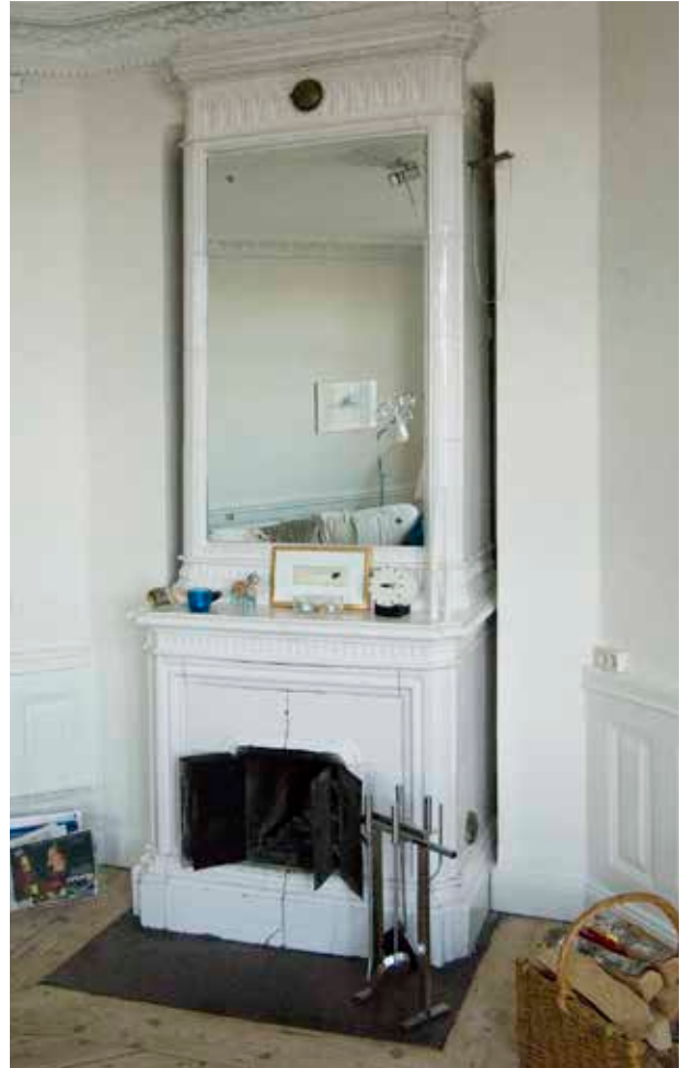
SLÄT SALKAKELUGN MED SPEGEL, FRÅN 1870-TALET.

murgenombrott. Kakelugnarna sparades i möjligaste mån. Arbetena var klara och slutbesiktade 1981.