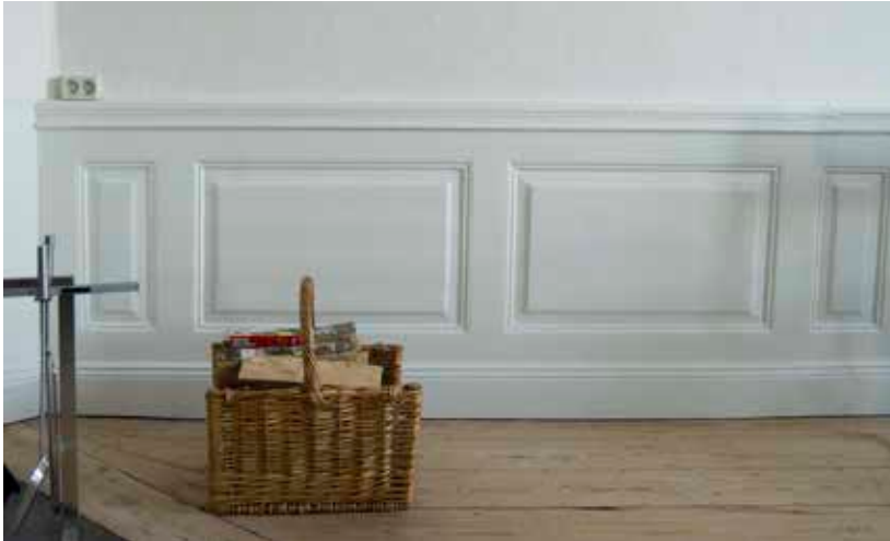
HALVFRANSK BRÖSTPANEL.