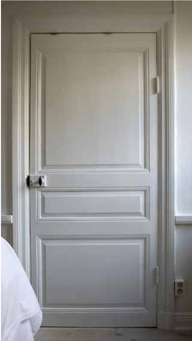
URSPRUNGLIG LÄGENHETSDÖRR MED TRE FILLNINGAR, UTANPÅLIGGANDE KAMMARLÅS OCH SAMTIDA FODER.

ett uthus i sten och tegeltak mot väster. Gården var avdelad mellan de tre äldre husen via murar med öppningar.