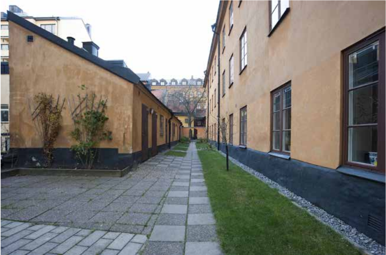
BOSTADSHUSETS GÅRDSFASAD MED GÅRDSHUSET PÅ VÄNSTER SIDA.

brandsäkerhet uppfördes många välproportionerade och gulputsade borgarhus av sten. De flesta av områdets bevarade trähus kan därför placeras i det tidiga 1700-talet.