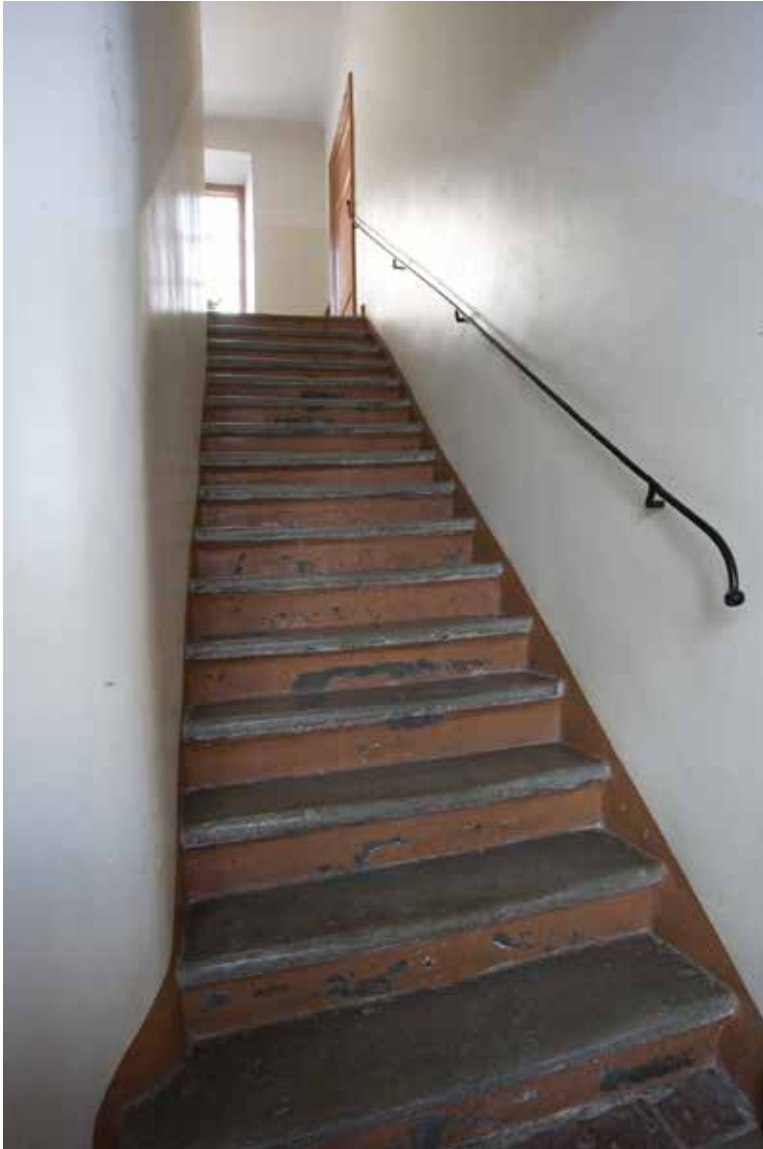
TRAPPHUS MED KALKSTENSTRAPPA.

hushåll ibland de arbetande klasserna”. Det fanns ett tillägg som sade att fattigvårdsstyrelsen skulle sätta hyran och att bostadshusen skulle innehålla högst 16 och minst fyra lägenheter. Lägenheterna skulle vara minst ett enkelrum med spis och kakelugn eller ett rum och kök. I ett av de första numren av Tidskriften för praktisk byggnadskonst och mekanik år 1850 skrevs ett antal rekommendationer. De tog upp betydelsen av tillräcklig lufttillförsel, bostadens storlek och belysning. Tidskriften framhöll att ett rum och kök var att föredra, i synnerhet om köket utrustades med spisar av Bolinders patenterade konstruktion och därigenom fick en värmekälla som gjorde även detta rum lämpligt för sovändamål. Vad