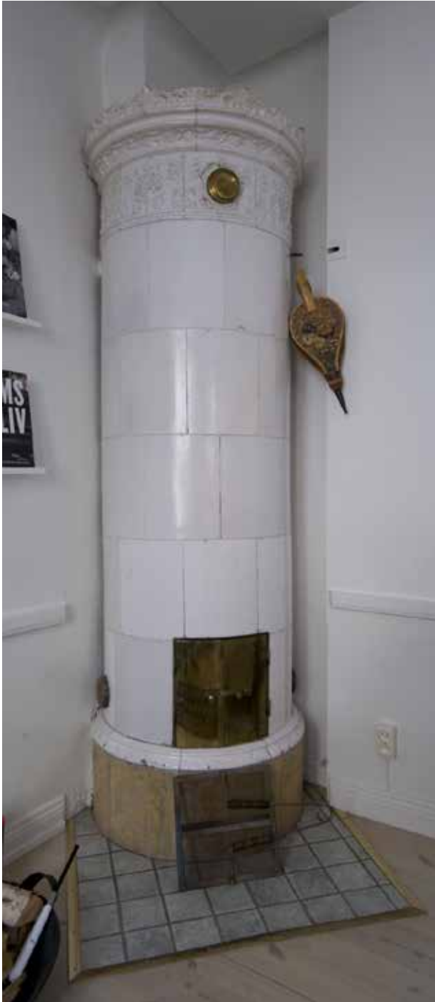
BEVARAD RUND KAKELUGN FRÅN 1800-TALET.

i gul kulör och mot taket finns en profilerad taklist. Taket är ett platt sadeltak av plåt, valmat mot Skånegatan och med takkupor. Fönstren är brunmålade och har en mittpost med tre rutor i varje båge. Fyra fönster är blindfönster. I bottenvåningen mot Skånegatan finns lokaler med en stor fönsteröppning. Entréportarna till trapphusen är indragna i murlivet. Port nummer 28 har en helfransk ytterdörr