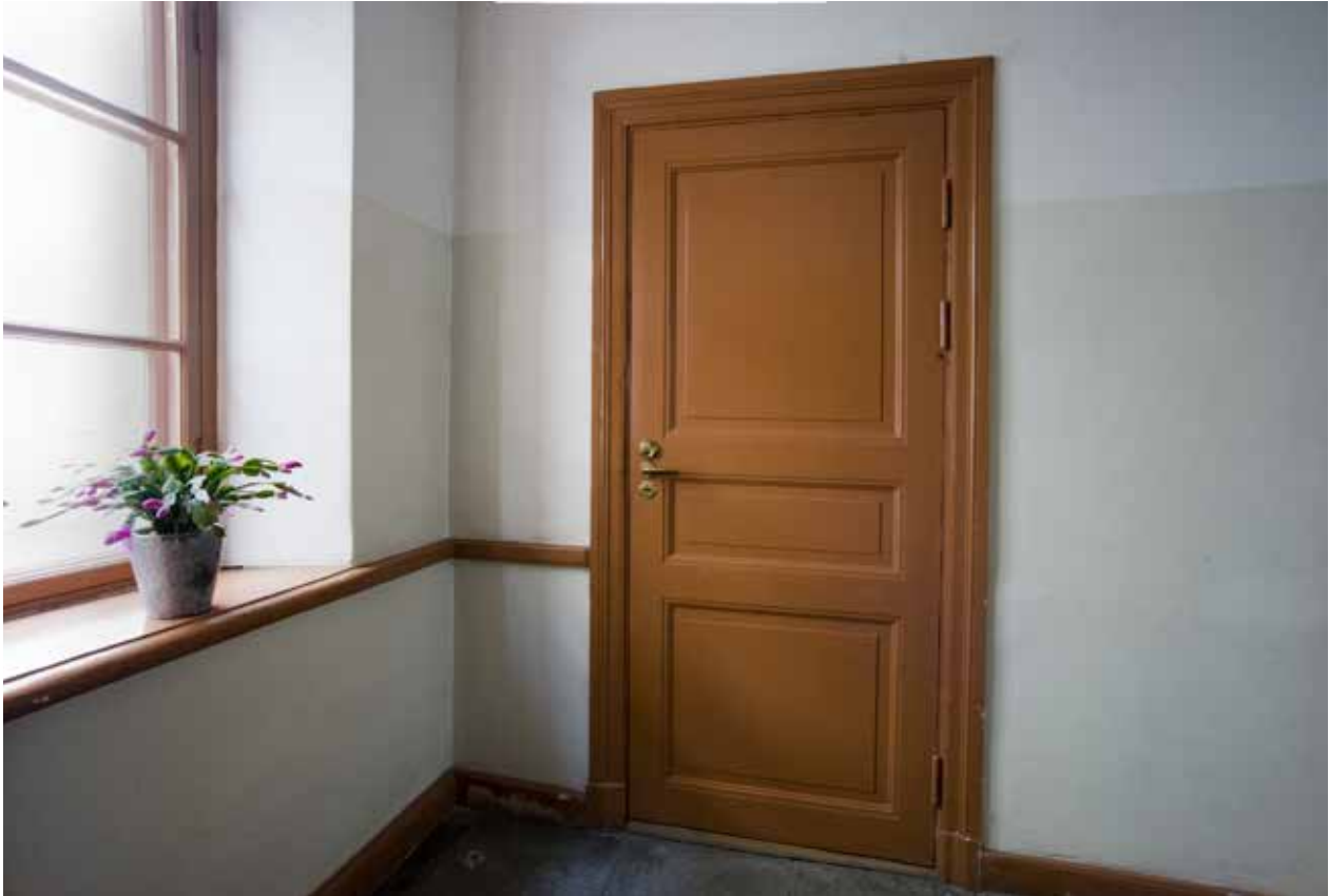
VILPLAN MED Fyllningsdörrar och profilerade foder.