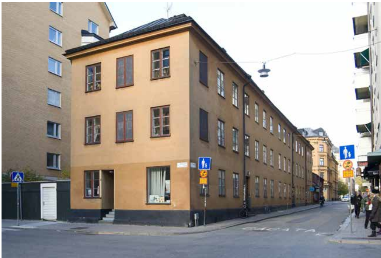
GATUFASAD VID HÖRNET SÖDERMANNAGATAN/SKÅNEGATAN. FOTO J MALMBERG

Bonden större 45 är ett trevåningshus i sten som uppfördes år 1853 av murargesällen Carl Johan Sandgren. Byggnaden har ett stort socialhistoriskt värde som ett av de få kvarvarande, tidiga hyreshus för arbetare i Stockholm.