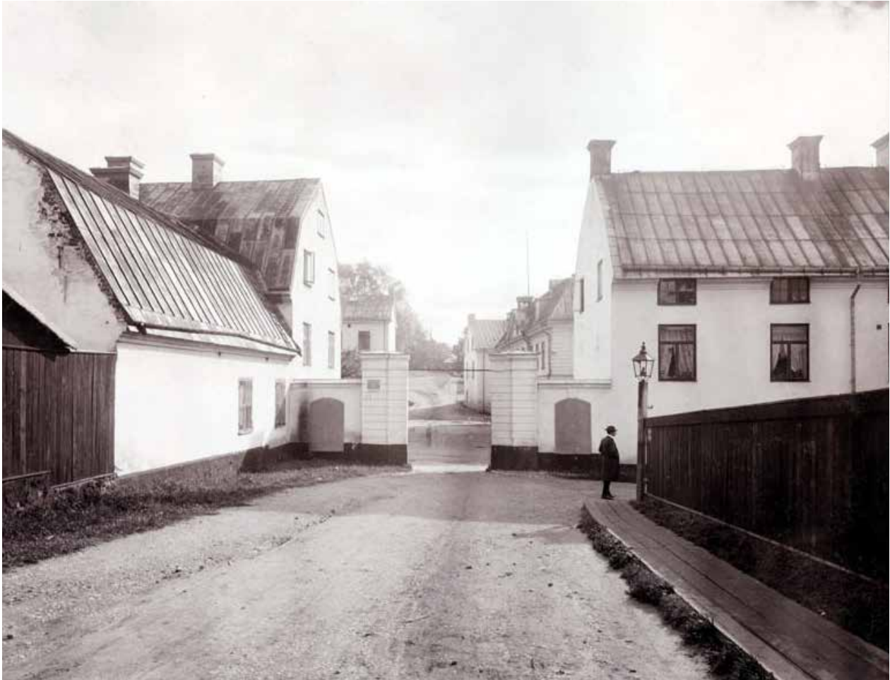
GRINDEN TILL BARNÄNGENS TEXTILFABRIK 1906. DEN AKTUELLA BYGGNADEN SYNS TILL HÖGER. SSMC000567

övriga enklare byggnaderna. Karaktäristiskt för den herrgårdslänkande miljön är att den är tydligt avskild från den omgivande staden i en egen, strikt hållen plan.