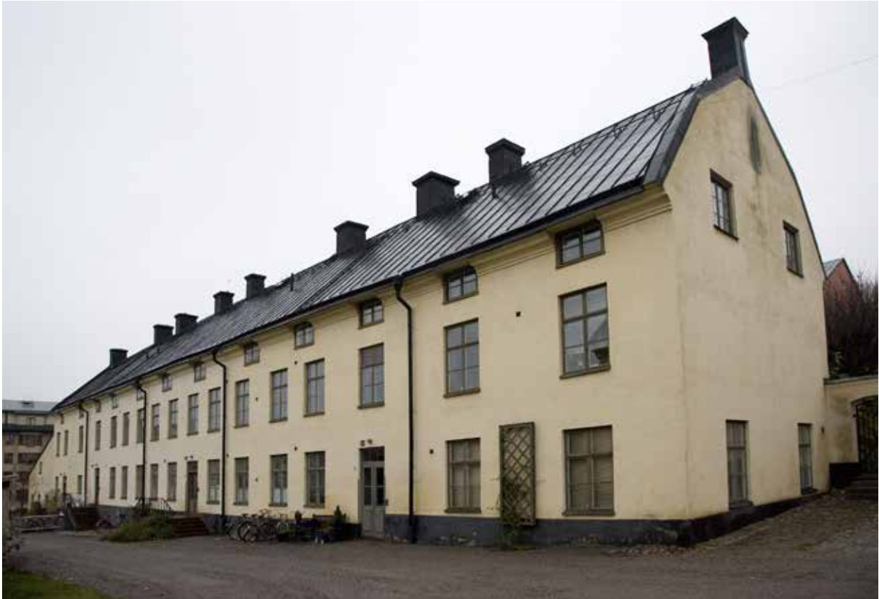
STENHUSET PÅ BARNÄNGENS GÅRD 3 UPPFÖRDES 1741.