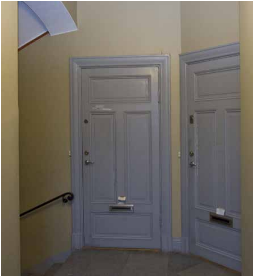
I TRAPPHUSEN FINNS FYRFYLLNINGSDÖRRAR, KALKSTENSGOLV OCH TRAPPOR MED SMIDESRÄCKEN.

vidga såväl markegendomen som bebyggelsen. Bland annat uppförde de huvudbyggnaden 1767-1769 som markerade inledningen till en omdaning av fastigheten under de nästföljande decennierna till en modern, herrgårdsliknande miljö. Barnängens ylleväveri var det största i Stockholm under större delen av 1700-talet och var vid 1760-talet Stockholms största arbetsgivare med 725 arbetare.