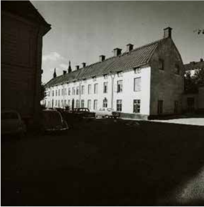
VY ÖVER FASTIGHETEN 1958. SSMF7772

Det tvåvåninga stenhuset på Barnängens gård 3 uppfördes 1741 som ett verkshus för Barnängens fabriker. I byggnaden fanns logement med väggfasta våningssängar, presshus, överskäreri, ruggningsrum och på vinden torkkramar. Sedan 1830-talet har det främst inrymt arbetarbostäder.