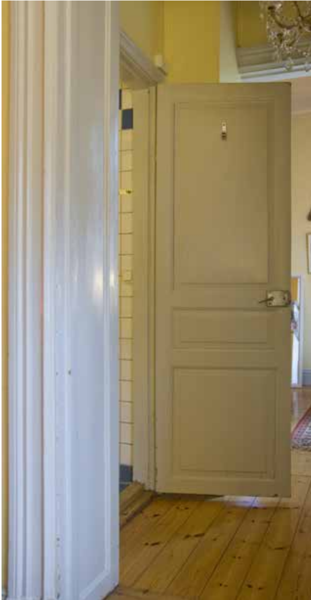
I LÄGENHETERNA FINNS PROFILERAD SMYGPANEL OCH FYLLNINGSDÖRRAR.