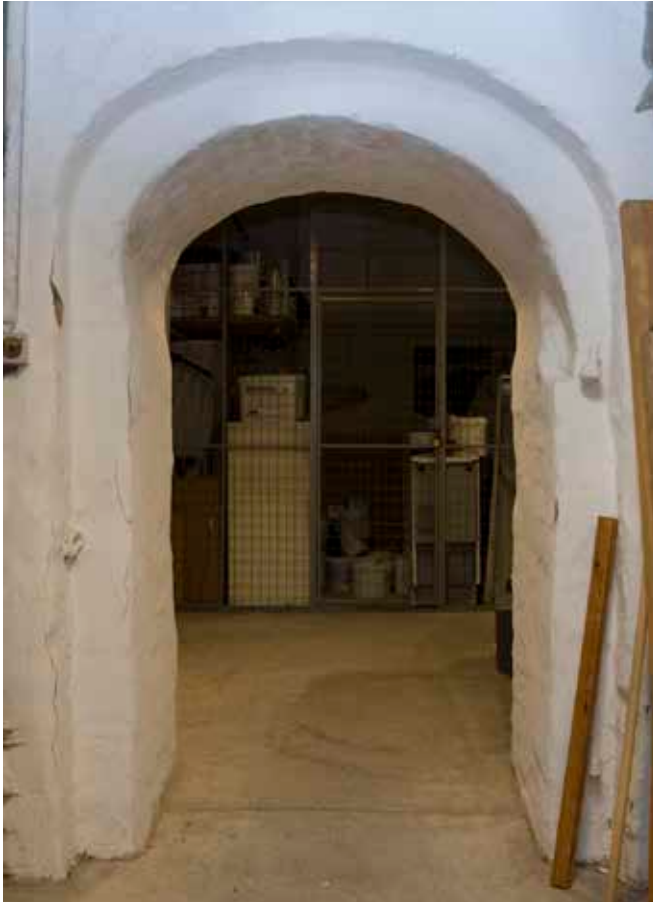
URSPRUNGLIG DÖRRÖPPNING I KÄLLAREN, MED ANSLAG OCH ÄLDRE GÅNGJÄRN.

trä. I bottenvåningen låg bodar, högre upp bostadsrum. Innertaket var av varierande slag; gipsade, panelade, målade på väv, eller bjälktak. Yttertaket var täckt med glaserat tegel, och till fastigheten hörde en liten gård med ett stall för två hästar. Även det lilla stenhuset i öster var tre våningar högt. År 1755 gjordes en värdering som innehöll en mer utförlig beskrivning av Blixenstråles egendom. I gathuset omnämndes den ännu bevarade, kryssvälvda portgången. På portgångens vänstra sida låg två välvda rum och en bagarstuga. Till höger om porten var trapploppet placerat närmast gatan, och längre in låg vedbodar samt ytterligare en bagarstuga. De båda våningarna ovanför innehöll var sin sal med bröstpaneler, spisel och målade vävtak, ett kök och ett visthus, samt flera rum. På den nedre av de tre vindarna var två kammare inredda. Gårdsrummet var belagt med sandsten och hade en stor körport mot Drakens gränd. På gårdens södra sida låg stallet kvar.