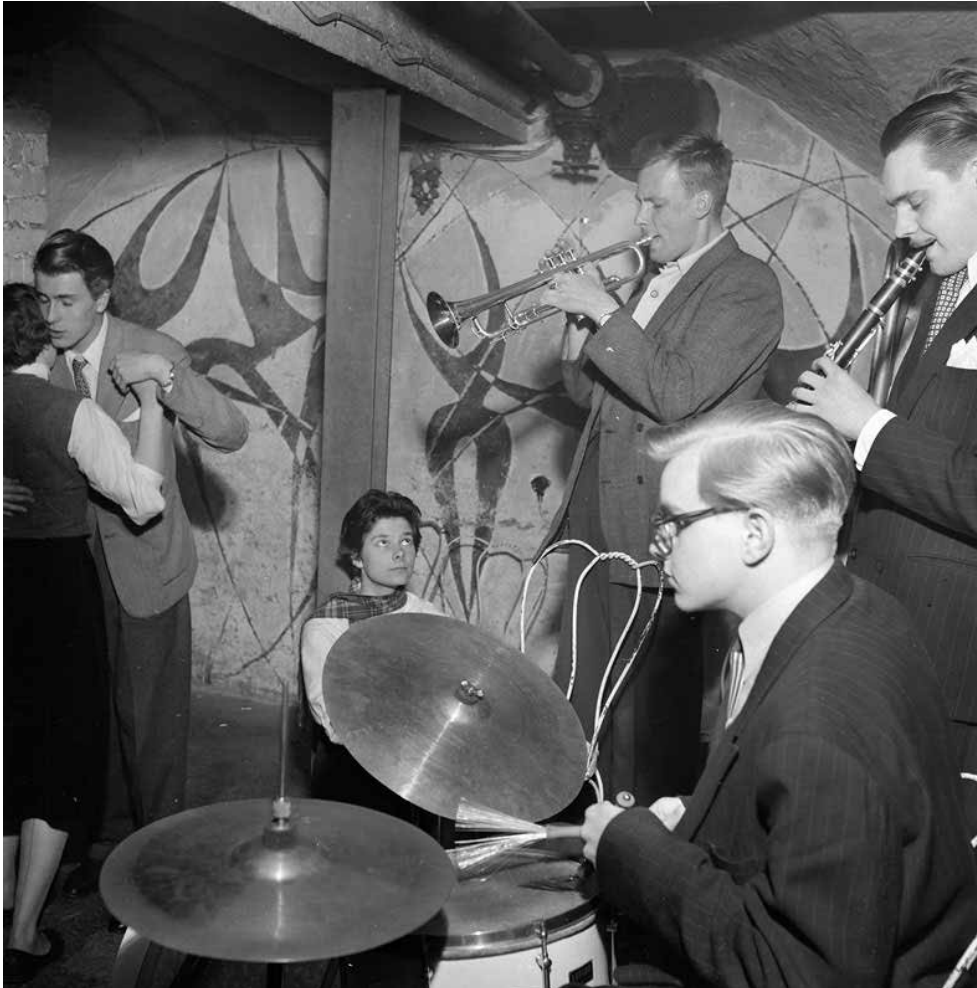
INTERIÖR FRÅN JAZZKLUBBEN GAZELLE 1952.

Apollo 5 bevarar 1600-talets kryssvalv i portgången och i den norra butiken. Under i stort sett hela 1700-talet och fram till 1850 bedrevs krog eller vinstuga i fastigheten. År 1782 bodde en ung amerikan, den blivande presidenten John Quincy Adams i fastigheten ett par veckor, på resa från Ryssland till Holland.