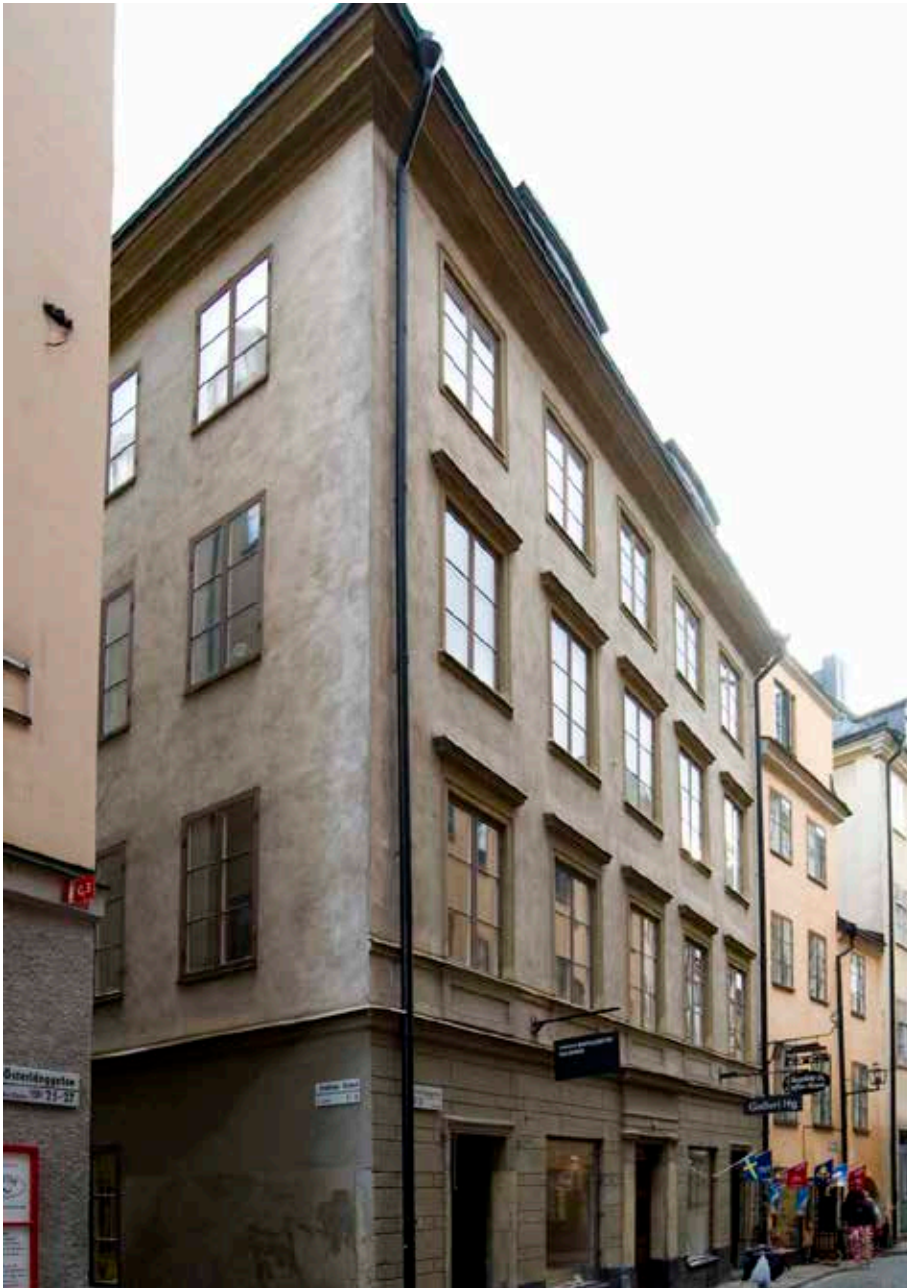
BYGGNADEN FICK SIN NUVARANDE VOLYM DÅ DEN FJÄRDE VÅNINGEN BYGGDES PÅ 1850.

Under 1700-talets mitt och senare hälft byggdes husen ofta på med en våning. Vindarna var nu mindre och taken flackare. Fasaderna utfördes släta och putsade, och rummen inreddes med kakelugnar och snickerier som till stor del finns bevarade i dag.