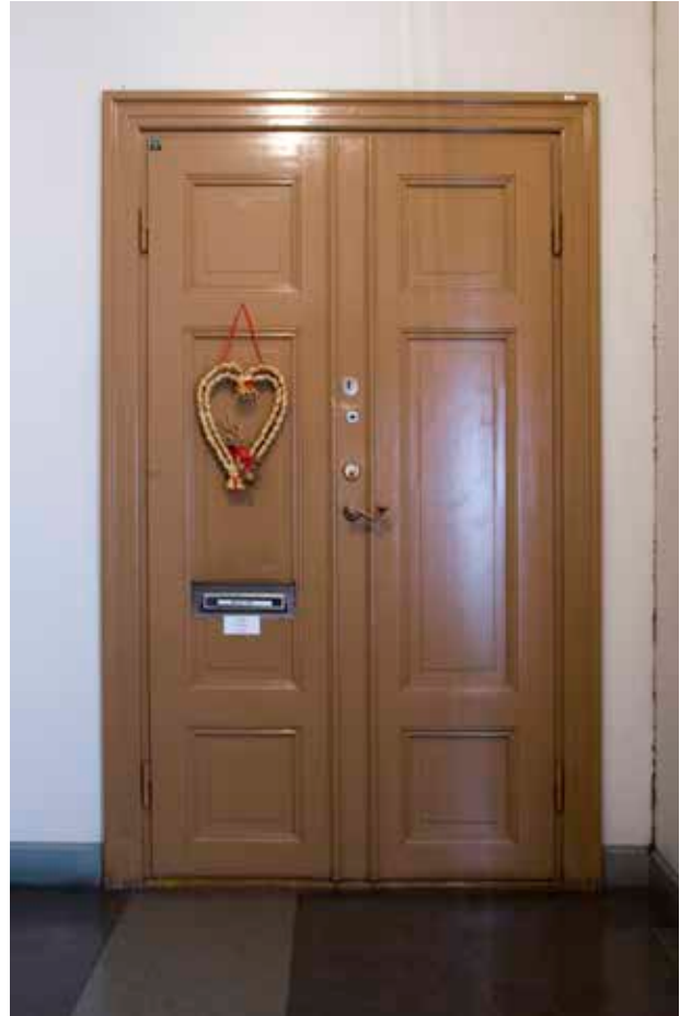
PARDÖRR FRÅN 1850 MED SAMTIDA FODER.

Stadsholmen. Det nya bolaget fick i uppdrag att förvärva, restaurera och modernisera bebyggelsen med hänsyn bland annat till kulturhistoriska värden. De första åtgärderna i stor skala genomfördes i kvarteret Cepheus och flera av de genomförda renoveringarna har varit goda exempel, inte minst de allra första insatserna som gjordes.