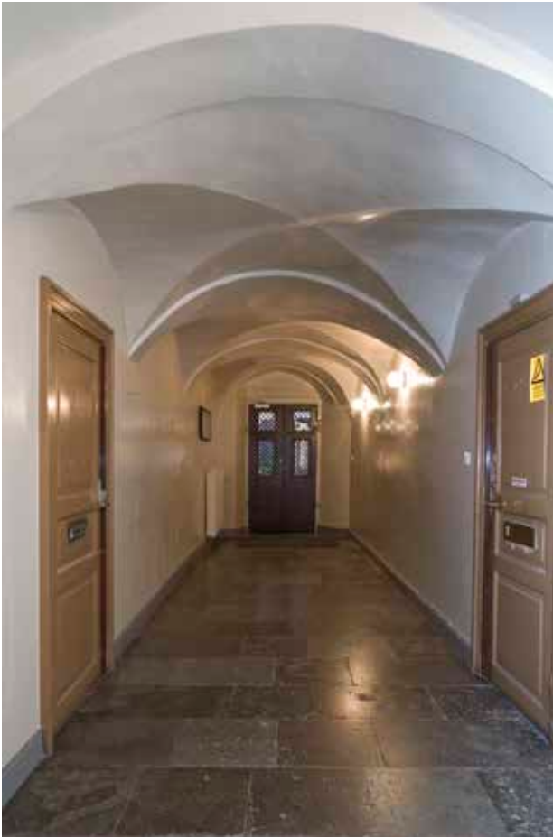
PORTGÅNGEN MED 1600-TALETS KRYSSVALV SETT MOT ÖSTERLÅNGGATAN.