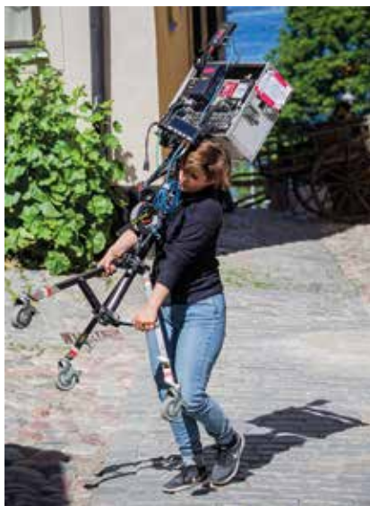
Direkt när inspelningen är klar plockas all utrustning bort omedelbart.