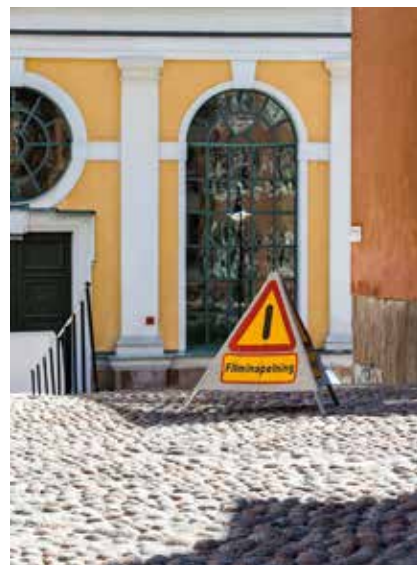
Filmspelningar kräver bra information till kringboende och ibland avspärrningar.