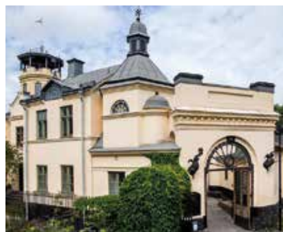
Disponentvillan ovanför Münchenbryggeriet kan du se den 6–8 oktober.

Kättingsmedjan på Söder Mälarstrand är en lokal som normalt sett inte