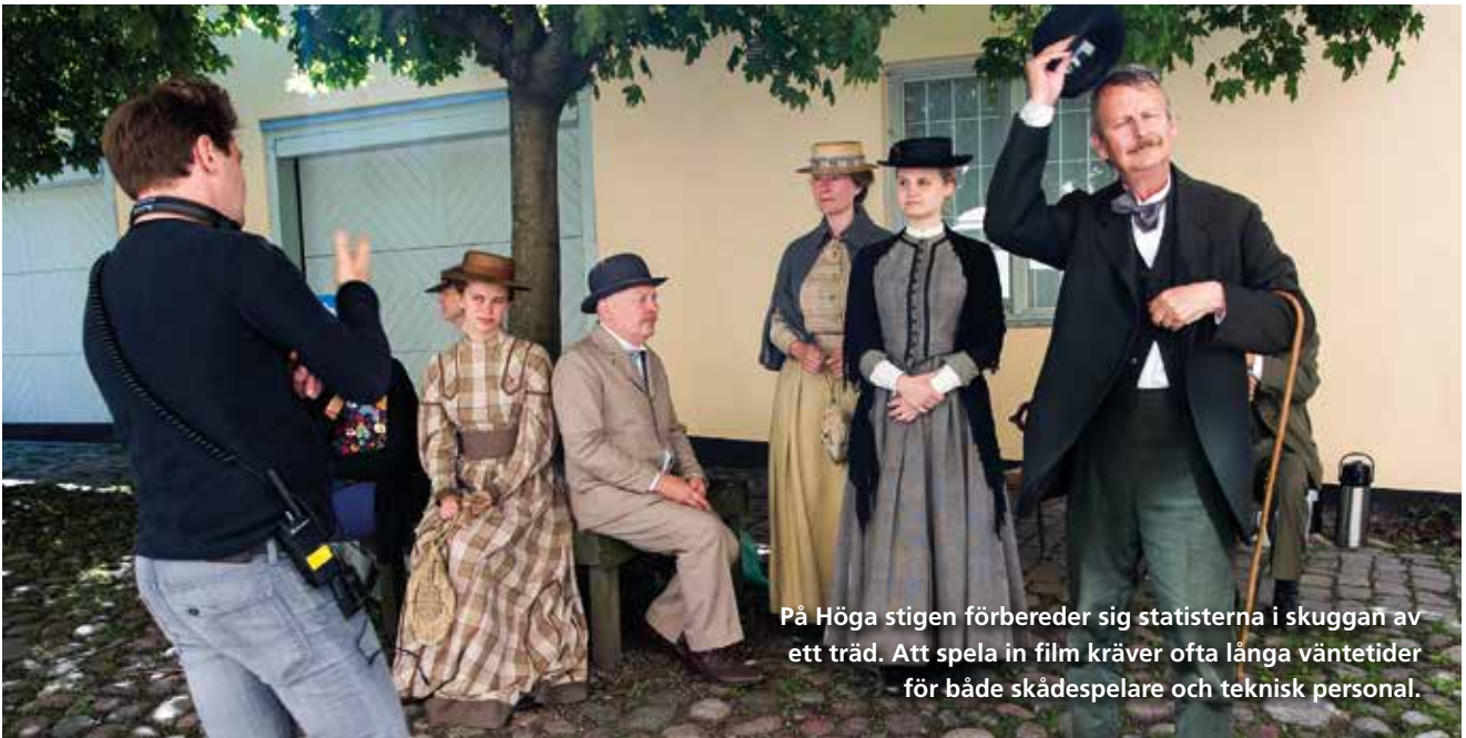
På Höga stigen förbereder sig statisterna i skuggan av ett träd. Att spela in film kräver ofta långa väntetider för både skådespelare och teknisk personal.