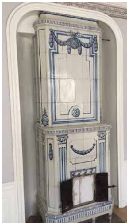
I Piperska palatset finns flera pampiga kakelugnar.

flyglarna. Bygget av palatset påbörjades 1685 och huset fick en till våning i mitten på 1700-talet. För fyra år sedan genomfördes en omfattande och nödvändig grundförstärkning av huset som vi berättat tidigare om i tidningen Stadsholmen.