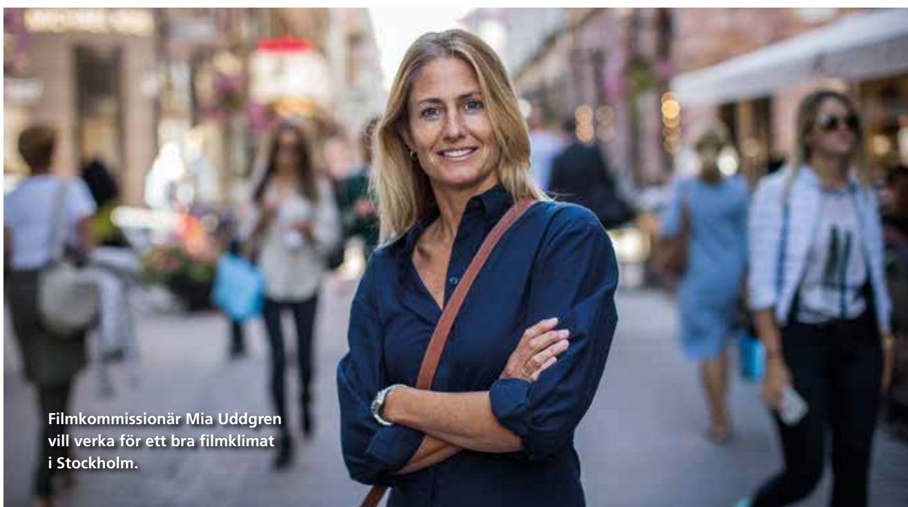
Filmkommissionär Mia Uddgren vill verka för ett bra filmklimat i Stockholm.